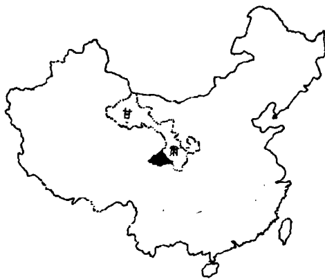
甘南藏族自治州位置图

甘南藏族自治州位于中国版图中心地、甘肃省西南部。南界四川，西接青海，北与临夏回族自治州的临夏县、和政县、康乐县相邻；东北部与定西地区渭源县，东与漳县、岷县毗连；东南与陇南地区的宕昌县、武都县、文县接壤。地理坐标东径 100^{\circ}45'45'' 至 104^{\circ}45'30'' ，北纬 33^{\circ}06'30'' 至 35^{\circ}34'00'' 之间。总面积 45 000 平方公里，东西广 423 公里，南北袤 270 公里。占全省总面积的 10%。