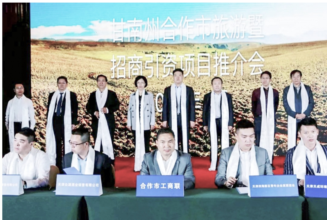
2019年合作市文化旅游暨招商引资项目推介会在天津滨海新区举行