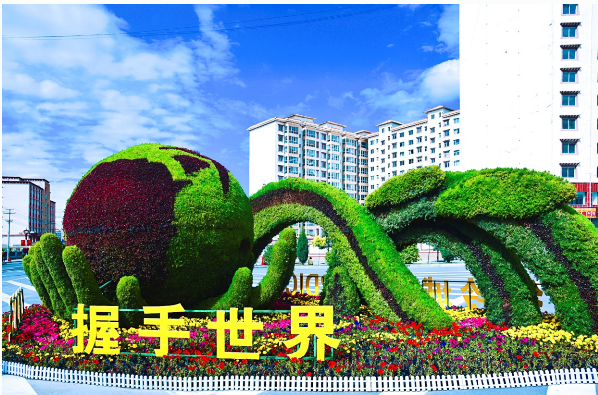
“一会一节”景观造型