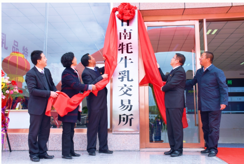
2019年9月24日，甘南牦牛乳交易所揭牌仪式在合作市产业园区举行