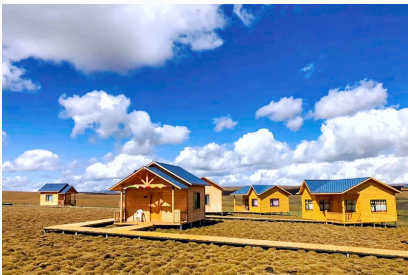
草原上兴起的藏家乐