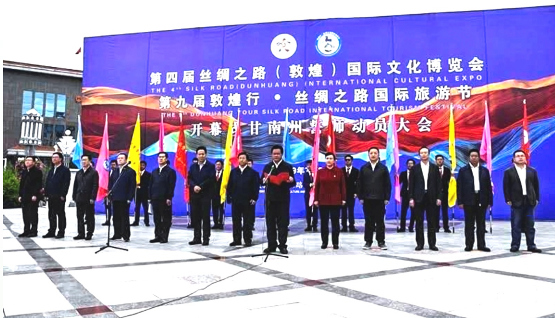
2019年7月23日，“一会一节”开幕式甘南州誓师动员大会在合作香巴拉主题文化广场举行。