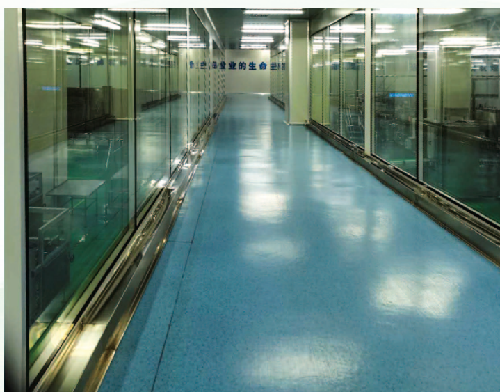
燎原乳品生产车间