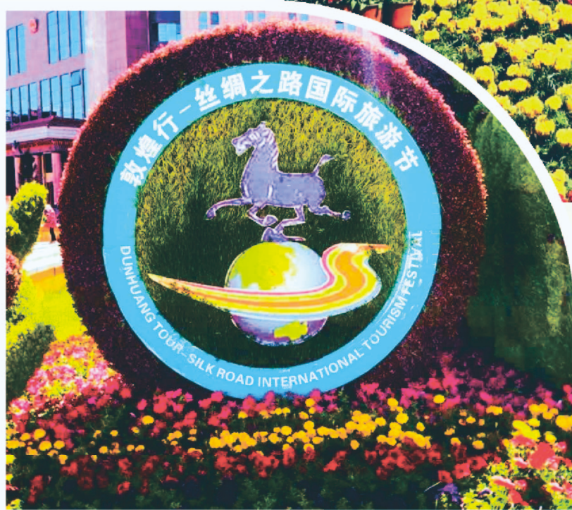
“一会一节”主题标牌