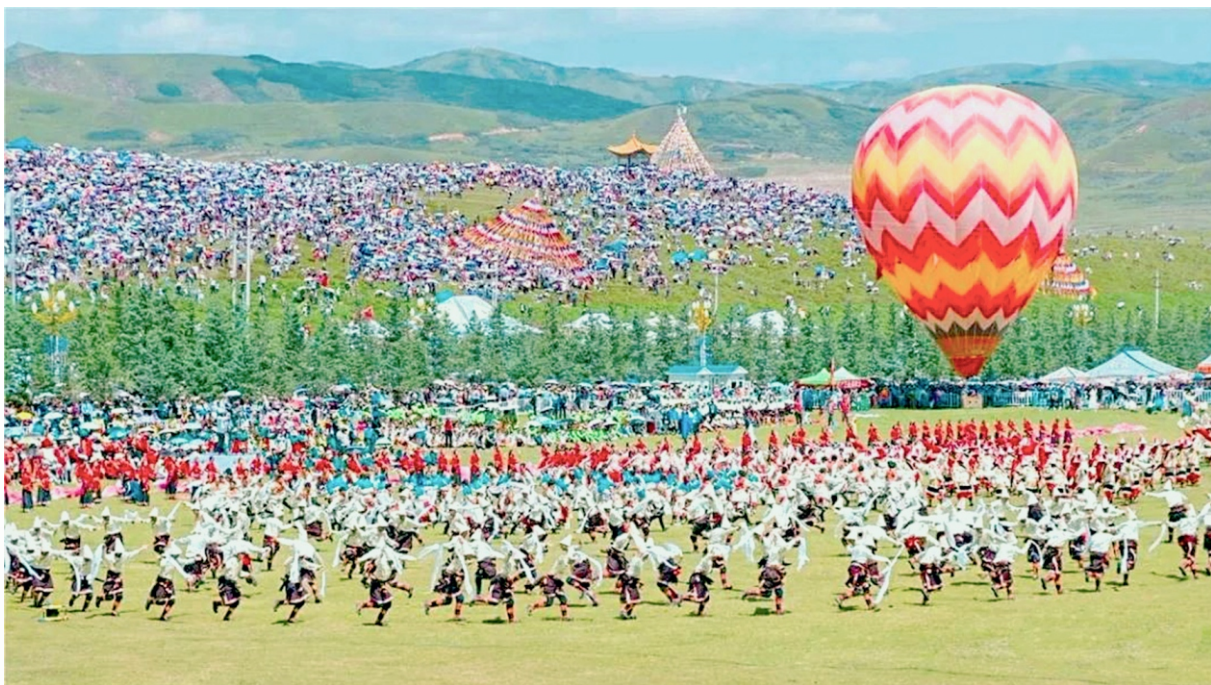
“一会一节”开幕式现场