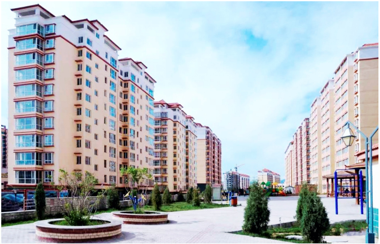
拔地而起的安居工程