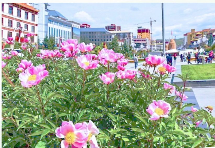
鲜花簇拥的休憩地