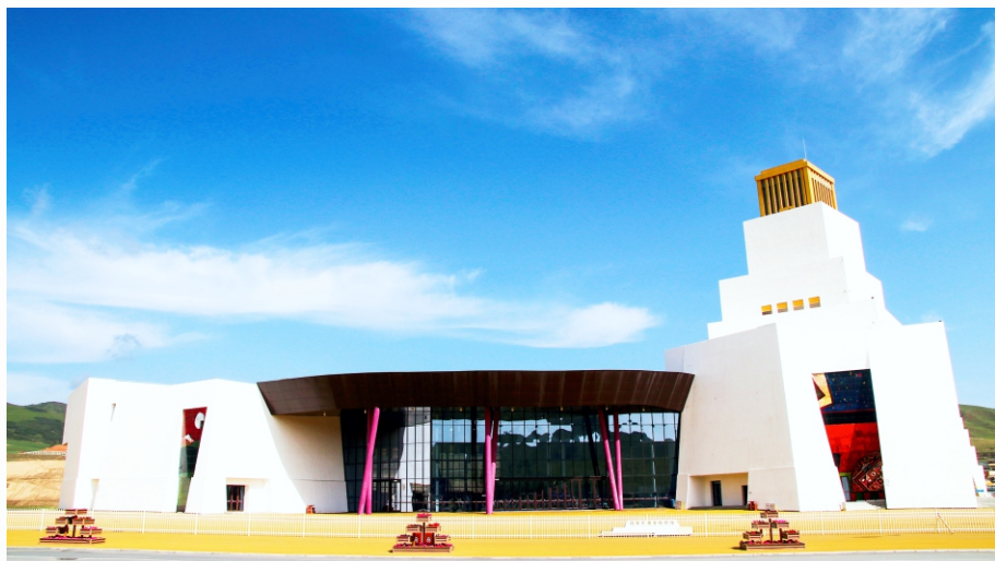
“一会一节”文旅会展中心