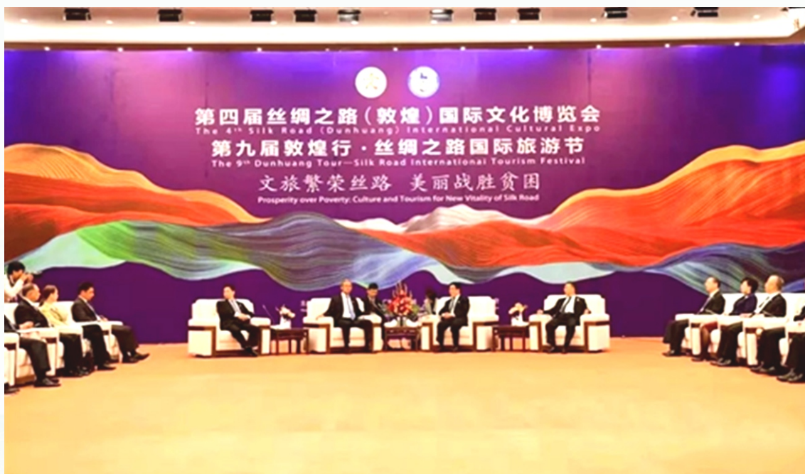
2019年7月30日，中共甘肃省委书记、省人大常委会主任林铎，中共甘肃省副书记、省长唐仁健在甘南合作会见了前来参加第四届丝绸之路（敦煌）国际文化博览会和第九届敦煌行·丝绸之路国际旅游节的外国嘉宾代表。