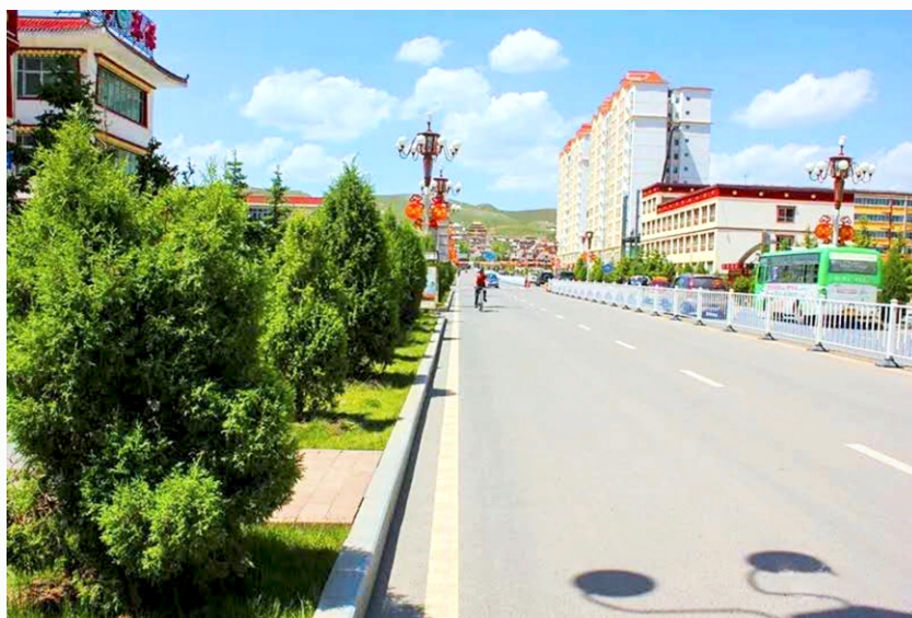
郁郁葱葱的绿化带