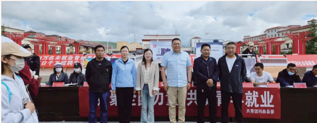
8月10日，县人社局联合总工会、玛曲县妇女联合会、共青团玛曲县委在格萨尔广场举办2023年玛曲县1万名未就业普通高校毕业生到基层就业项目暨百日千万招聘专项行动招聘会