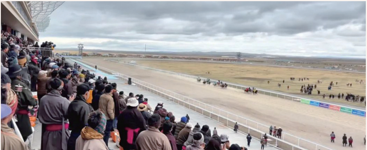
5月1—3日，玛曲县2024年九色甘南格萨尔夏季“蒋朵杯”赛马会成功举办