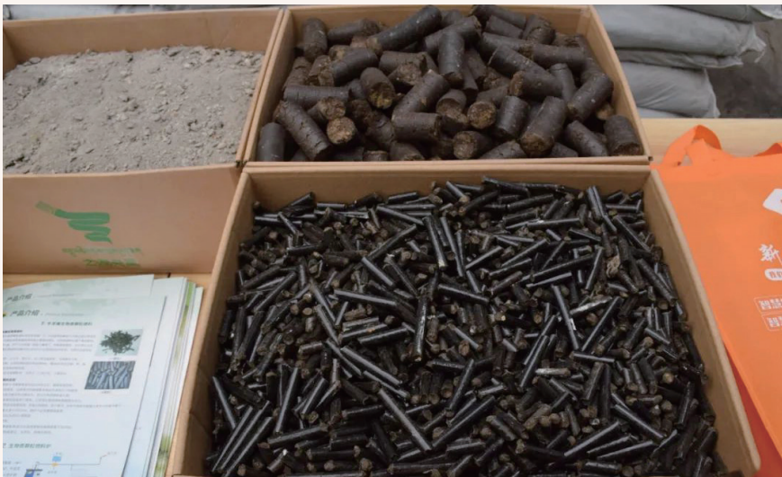
7月5日，全州“产业发展大观摩、重点工作大检阅”主题观摩团来到玛曲县之派央里牛羊粪加工有限公司