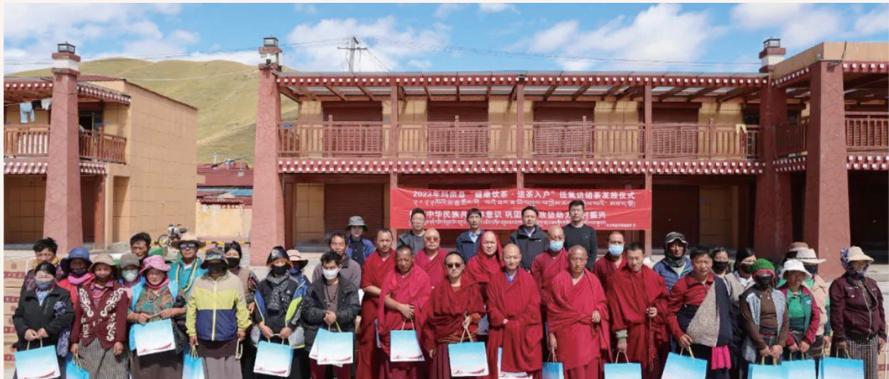
9月22日，阿万仓镇举行“健康饮茶·送茶入户”低氟边销茶发放仪式