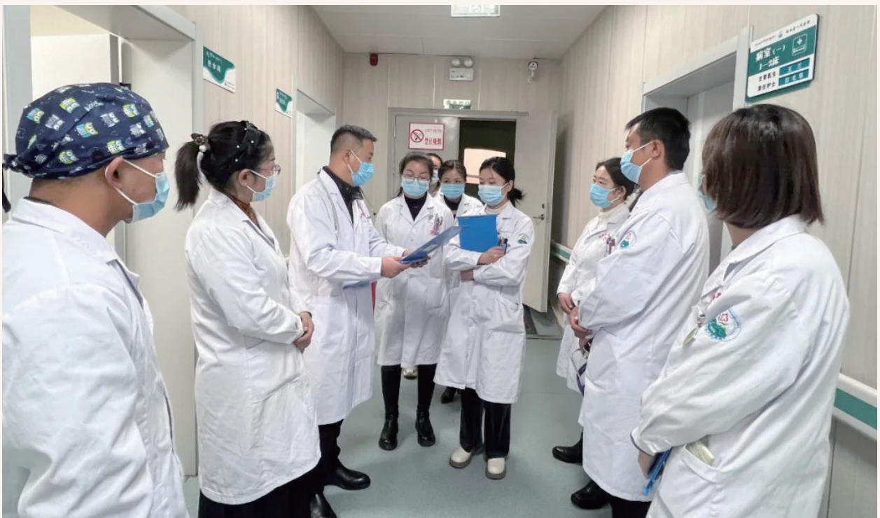
11月24日，甘南州儿科质控中心督导组一行，来玛曲县人民医院对儿童呼吸道感染性疾病规范化诊疗情况进行现场督导检查