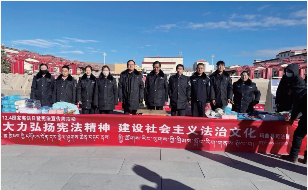
12月1日,玛曲县开展以“大力弘扬宪法精神,建设社会主义法治文化”为主题的“12·4国家宪法日”暨宪法宣传周活动启动仪式