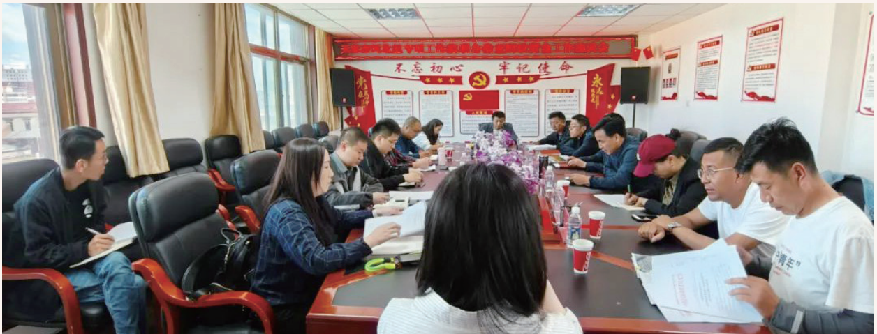
8月8日,天津市河北区专项工作组一行对玛曲县2022年和2023年河北区对口帮扶资金使用情况、项目实施进展情况、资金监管及项目预算绩效管理情况等工作听取了汇报并召开座谈会议