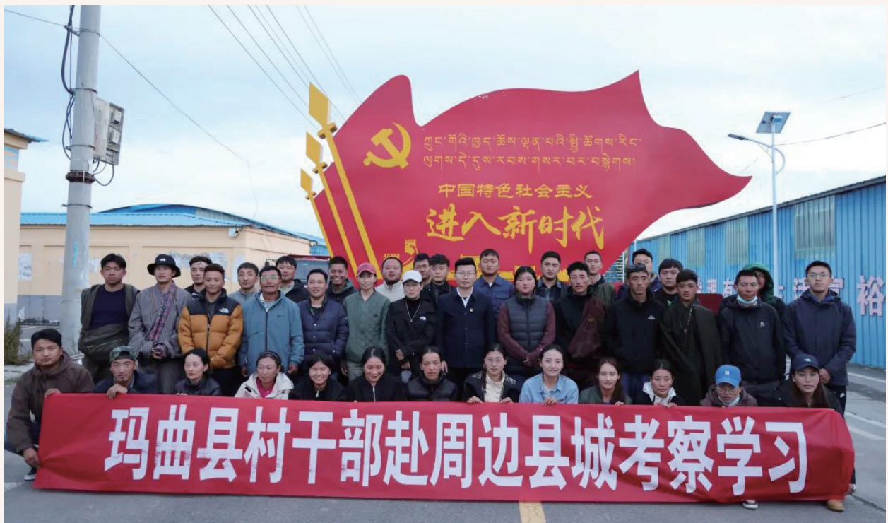
9月19—22日，玛曲县委组织部组织全县41个建制村和非建制村的41名村干部及村级后备干部赴周边兄弟县市开展赴外观摩学习活动