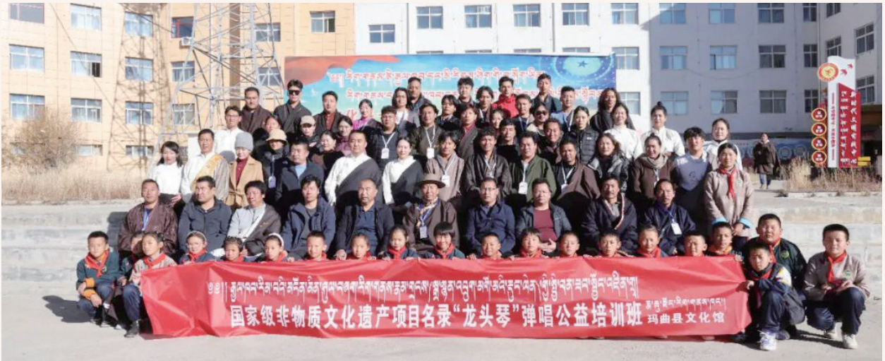
11月6日，玛曲县2023年国家级非物质文化遗产项目名录“龙头琴”弹唱公益培训班在县文化馆开班