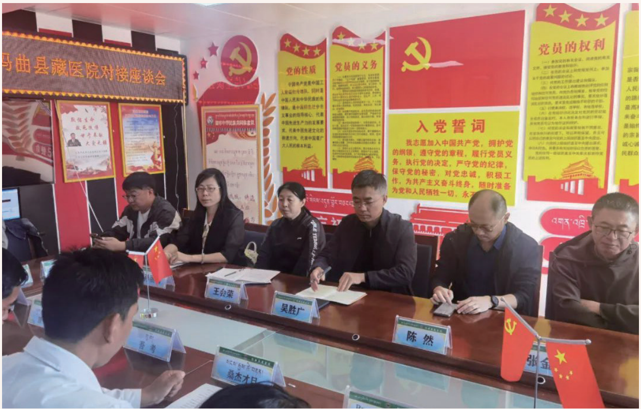
9月4日，天津市蓟州区中医医院领导、专家一行到玛曲县藏医院开展三级中医医院对口帮扶对接工作