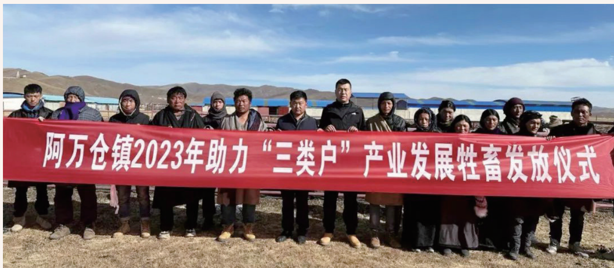
11月21日，阿万仓镇举行助力“三类户”产业发展牲畜发放仪式

11月9日，国家电力投资集团公司绿色能源公司项目开发总经理吴庆方、陕西墨岩投资管理有限公司总经理于浩到玛曲县对接洽谈风力发电项目