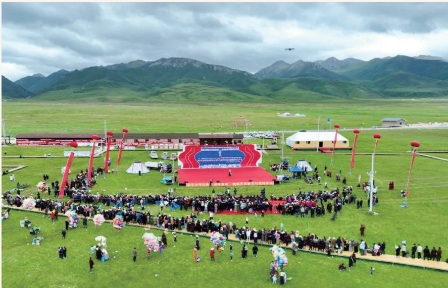
7月3日，玛曲县欧拉秀玛乡第六届西梅朵塘旅游艺术节开幕