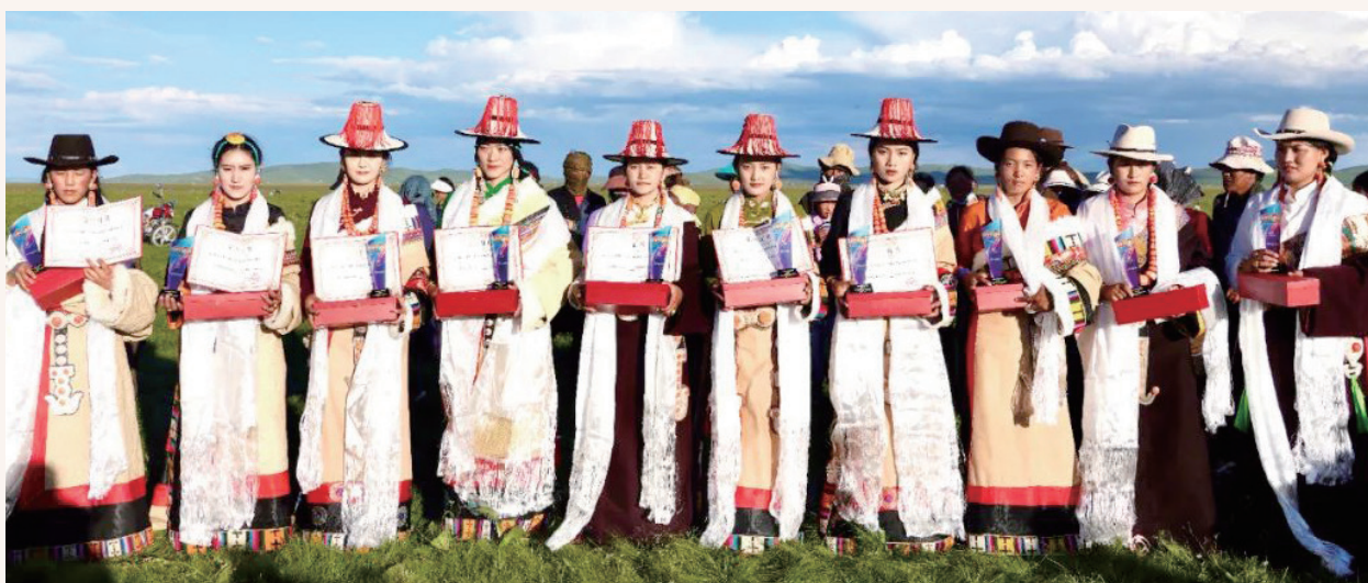
8月2日，玛曲县曼日玛镇第二届瓦须乔科民族文化体育节在扎西塘隆重开幕