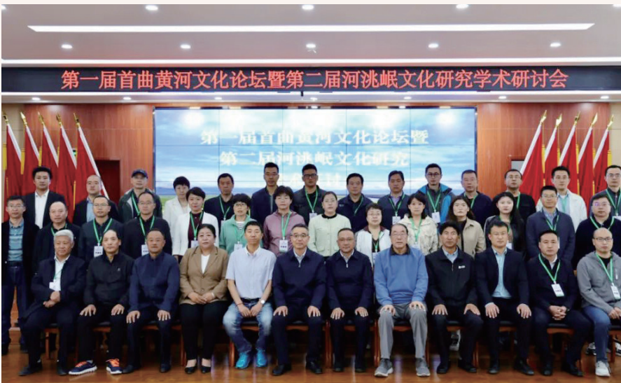
7月9日，第一届首曲黄河文化论坛暨第二届河洮岷文化研究学术研讨会在玛曲开幕