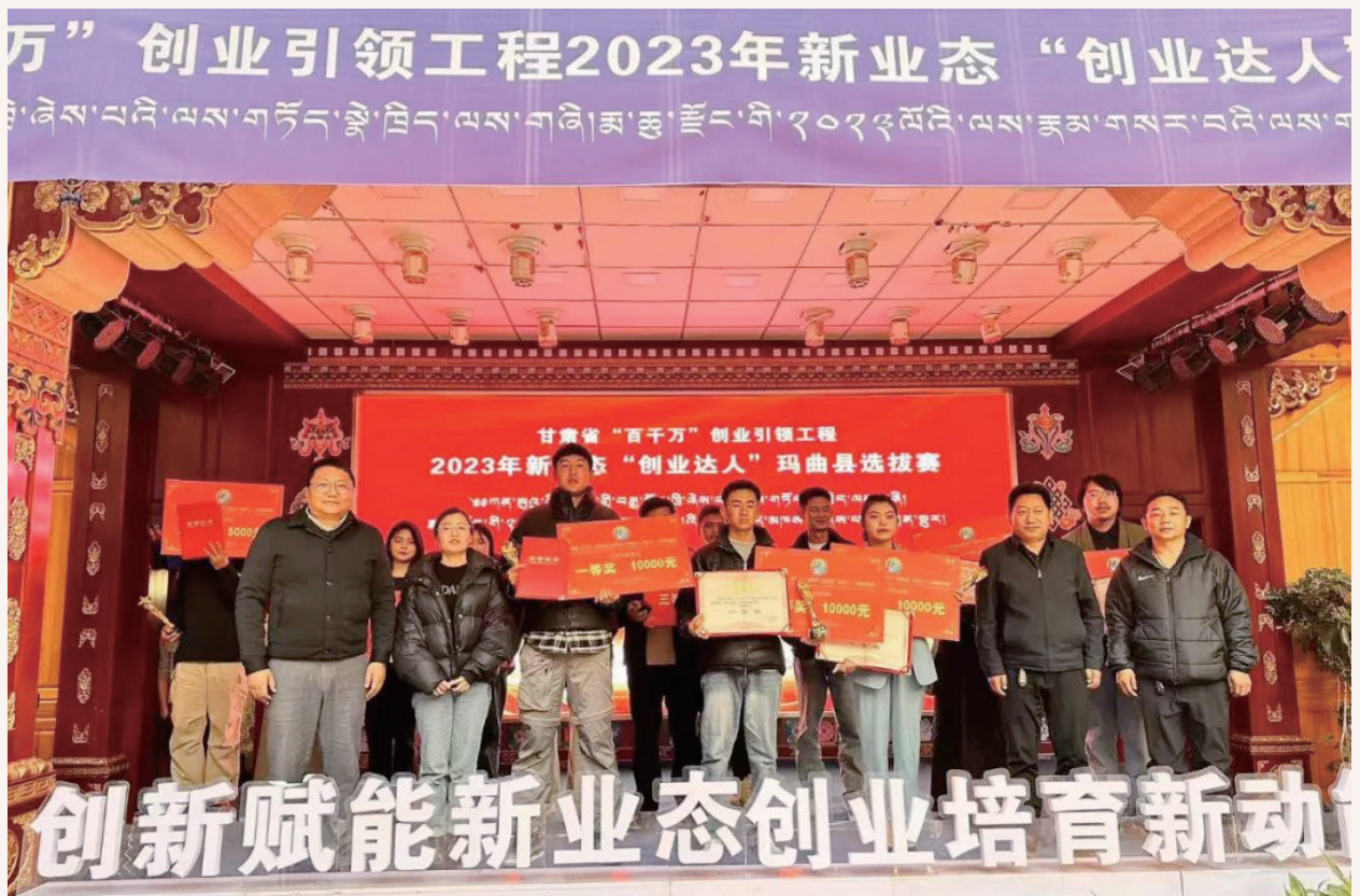
12月8日，县人社局委托甘肃省金程企业管理有限公司在卓格领地一楼，举办了甘肃省“百千万”创业引领工程2023年新业态“创业达人”玛曲县选拔赛