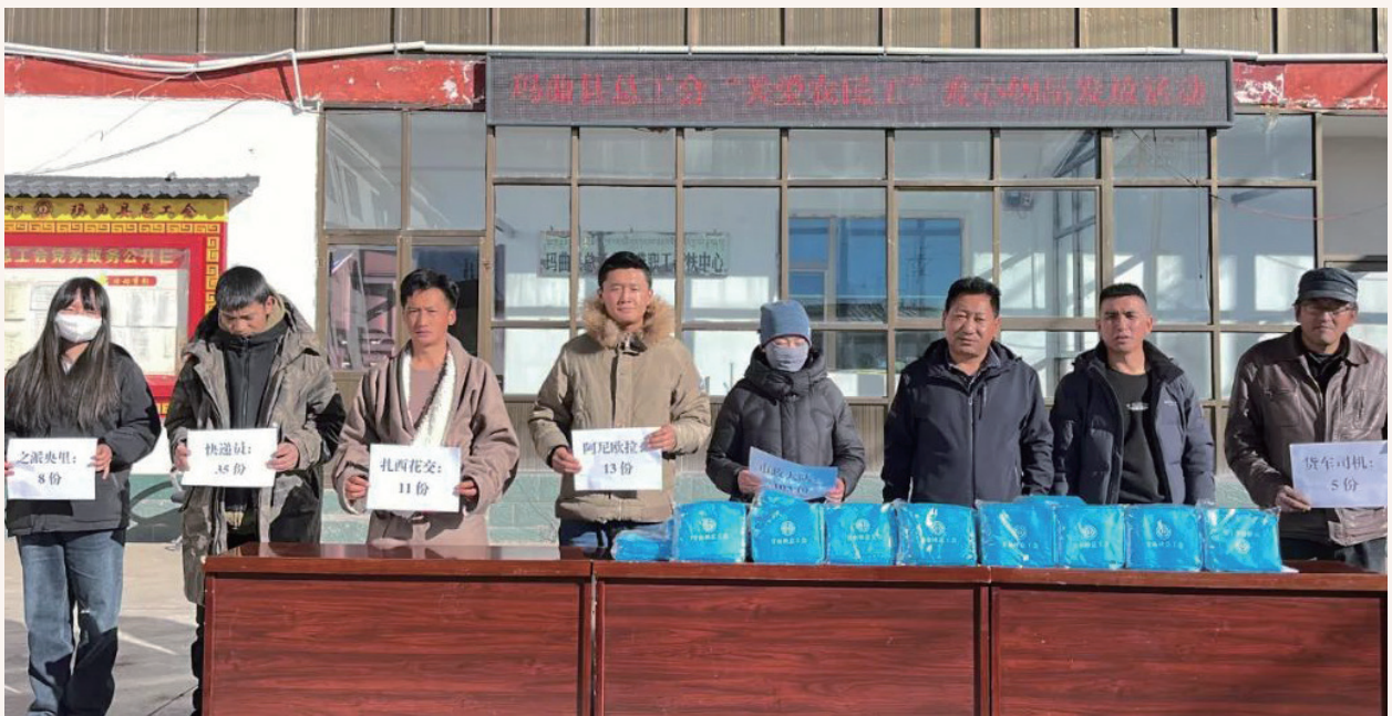
11月23日，县总工会开展“关爱农民工”爱心物品发放仪式