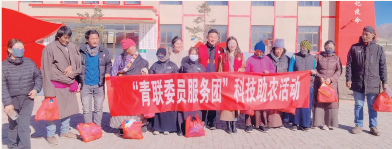
11月1日，共青团玛曲县委组织州青联委员、玛曲县之派央里公司负责人到尼玛镇贡玛村开展“青联委员服务千村科技兴农”助力乡村振兴帮扶活动