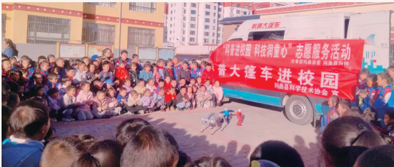
11月22日，共青团玛曲县委、玛曲县科协走进县城关九年制学校开展“科普进校园 科技润童心”志愿服务活动