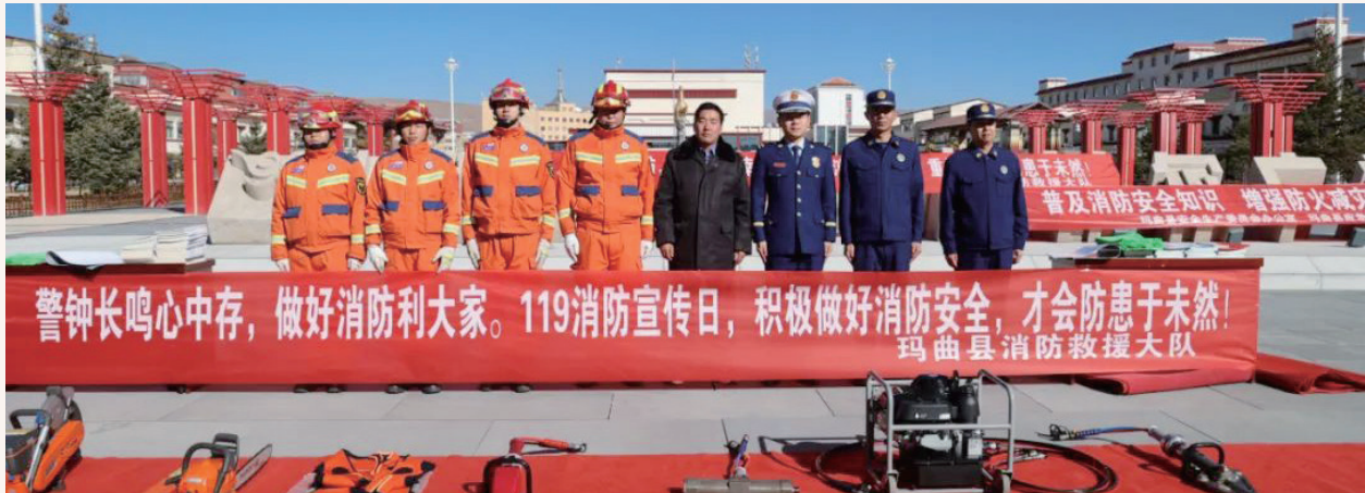
11月9日，玛曲县消防救援大队在广场开展“119消防宣传日”活动