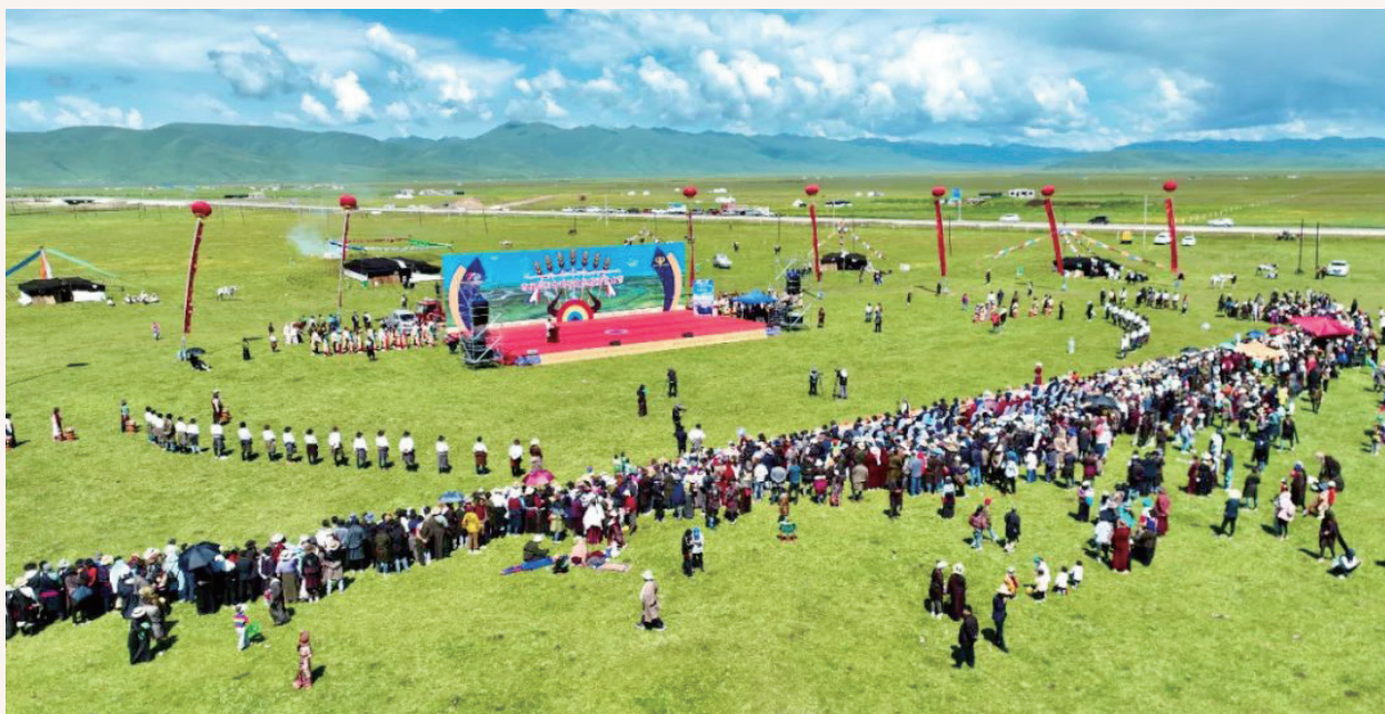
7月17日，首届阿万仓牦牛文化旅游艺术节在贡赛喀木道湿地开幕