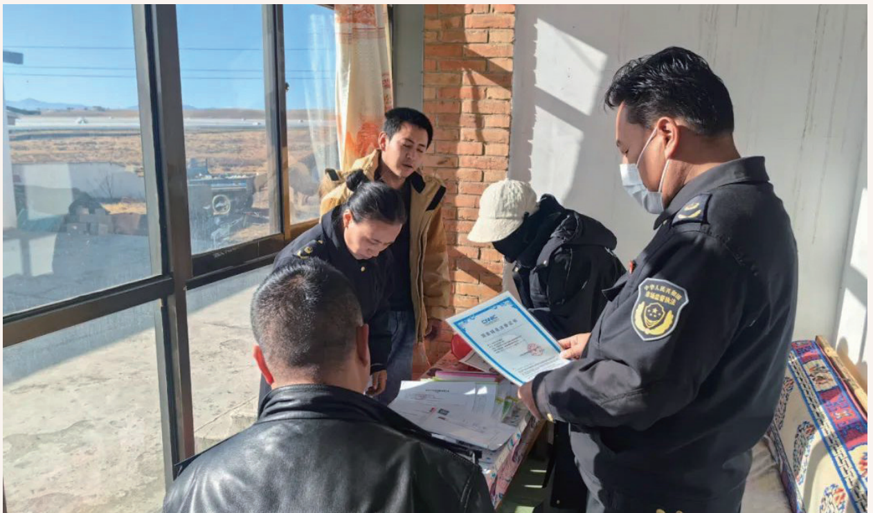
12月13日，玛曲县市场监督管理局对辖区内食品生产企业开展飞行检查