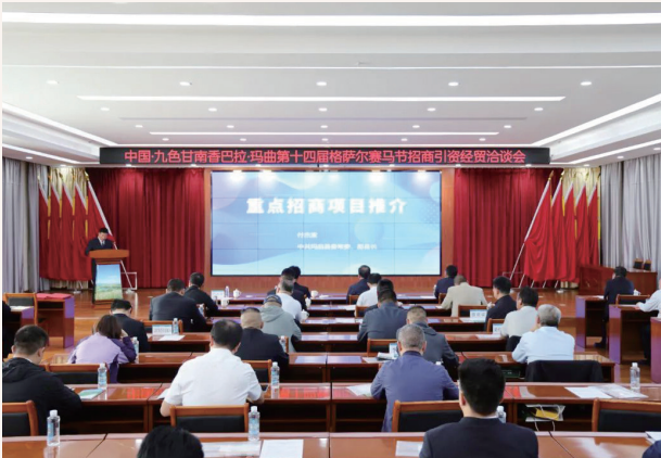
8月12日,玛曲县召开中国·九色甘南香巴拉·玛曲第十四届格萨尔赛马节招商引资经贸洽谈会