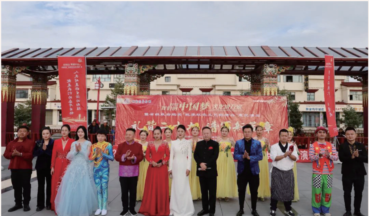
9月17—18日，由中共甘肃省委宣传部组织、甘肃省文化和旅游厅主办，甘肃演艺集团承办，甘肃演艺集团敦煌艺术团演出的“我们的中国梦”文化进万家暨省级政府购买“陇原红色文艺轻骑兵”惠民演出在玛曲县格萨尔广场和阿万仓镇上演