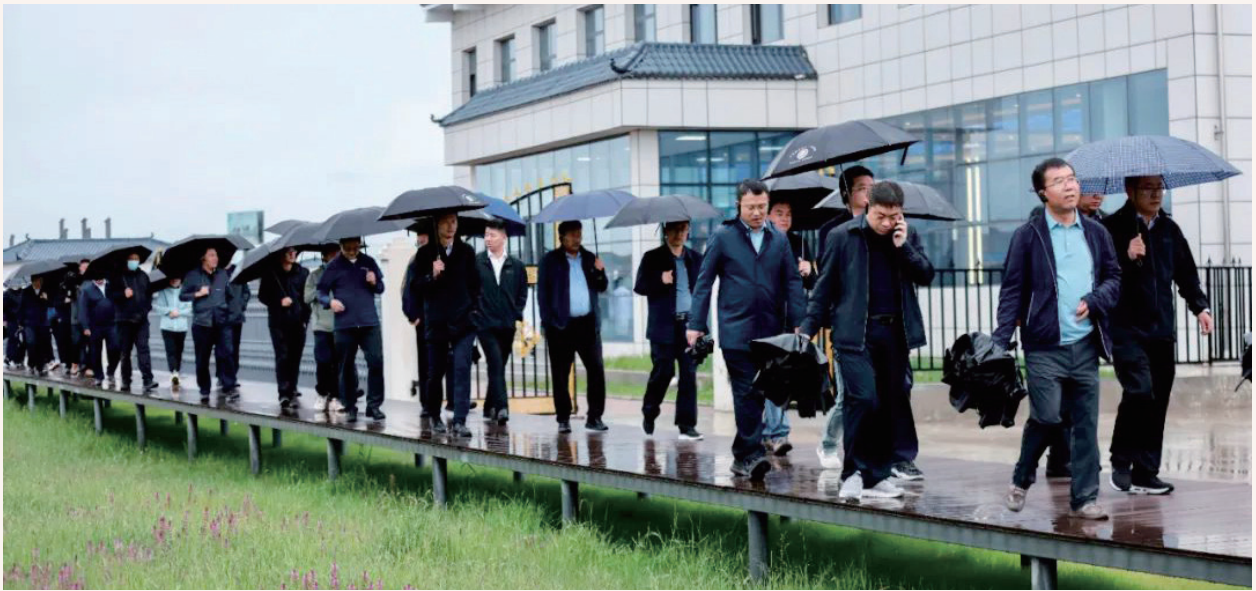
7月5日，全州“产业发展大观摩、重点工作大检阅”主题观摩活动走进大美湿地，秘境玛曲