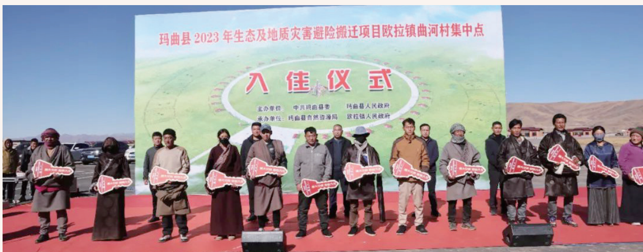
11月10日，玛曲县举行2023年生态地质灾害避险搬迁欧拉镇曲河村集中安置点搬迁入住启动仪式