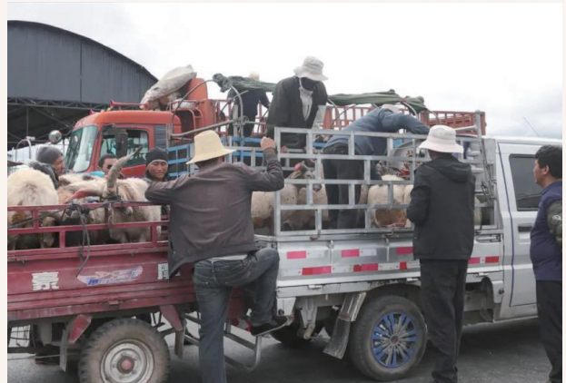
9月,甘青川玛曲县活畜交易现场