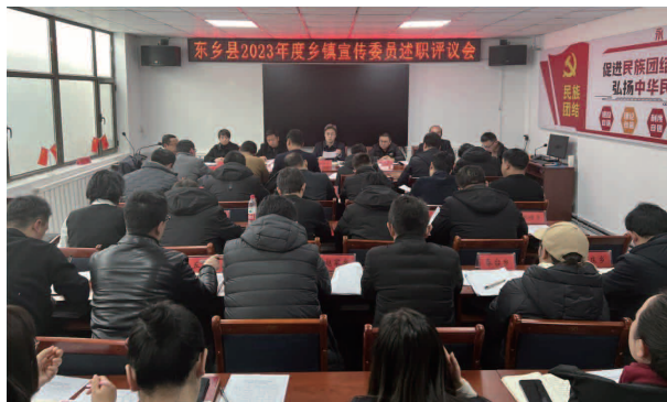
召开2023年度乡镇宣传委员述职评议会

【机构】东乡县委宣传部（网信办、外宣办、县新时代文明实践中心办公室、县互联网信息中心）有工作人员23名，其中县级干部3名（含职级待遇2名）、科级干部16名。