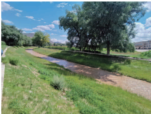
巴谢河水环境综合治理工程

理所、村有水管员”的四级管理模式，全面畅通信访渠道，科学调度全县供水管网，充分发挥管护运行体系，止年底，省州县各类平台共计接到群众反映事项 464 件，其中微信公众号 30 件，县级反馈 212 件，监督电话 222 件，已全部整改销号，对群众反映问题，通过供水服务微信群、供水一体化系统、供水微信公众号和服务电话记录本建立线上线下服务台账，安排专人受理，责任到人，做到反映一处、处理一处、回访一处、销号一处，做到“件件有回应、事事有着落”，形成了投诉问题闭环处置机制，提升了供水服务水平。同时积极对接州南阳渠管理局加大牙塘水库来水量，组织供水中心各供水站开展村级供水管网末端排查 76 次，有效减少现有水量的跑冒滴漏，保障全县供水稳定。督促州水投完成那勒寺达板空新建水厂与那勒寺川供水管网的连接，并试通水运行，有效补充沿线供水水量。完成考勒乡抗旱应急泵站扩容改造，解决考勒全乡人饮供水不足的问题。通过实施农村产业供水及灌溉设施维修改造工程建设进度，对全县受损 51 处供水管网和提灌机电设备进行了维修改造。同时通过“城乡供水一体化系统”加大对各水厂水量的调配，错峰调节，保障全县的供水稳定。