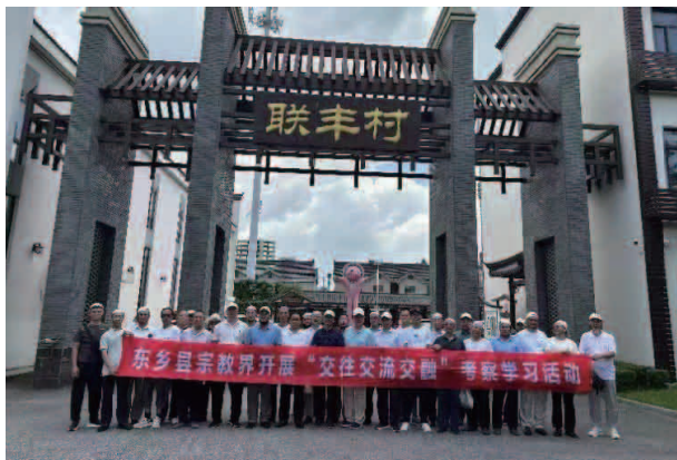
东乡县宗教界开展“交往交流交融”考察学习活动

治共享的社会治理格局，严格执行《民族区域自治法》，加强法制宣传教育，使党的民族政策和民族区域自治制度全面落实。持续推进联合执法机制，县委统战部联合县市监、城管、商务等部门常态化开展食品安全检查。2023年，督促指导清真食品生产经营主体办理《清真食品许可证》28家，删除下架企业不当宣传内容6篇。