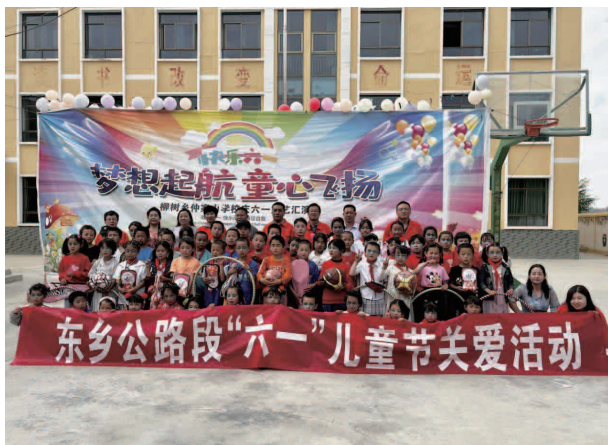
“六一”儿童节关爱活动

【四新技术应用】推广四新技术应用，在排水构造物维修施工中继续采用PE排水管代替传统圪工构造物；在公路沉陷处治中，通过在路面基层上铺玻纤网抗裂贴的方式，有效抑制路基裂缝向路面层的传递；在路基冲沟、护坡和缺口修复过程中，通过扦插红柳、播种苜蓿等植物防护手段，实现固土护坡、减少冲刷、稳定路基边坡的目的。