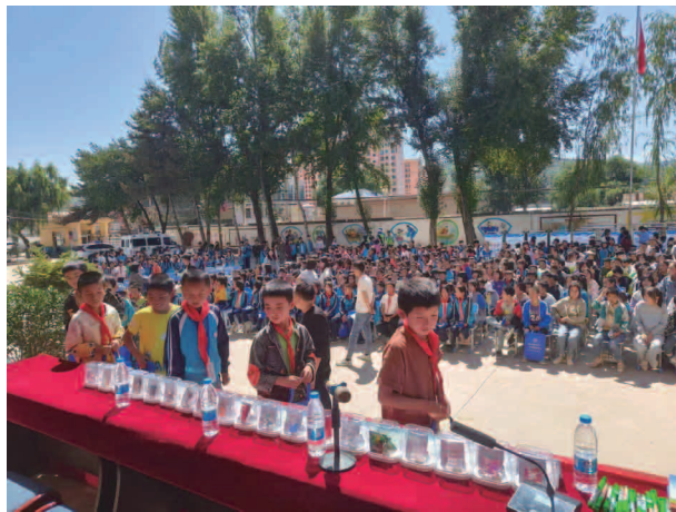
开学第一课，禁毒齐步走活动

农村厕所革命。全年实施旱厕改造共建设 467 户，其中生态宜居及自然灾害搬迁 93 户，其他村新建 374 户，其中水厕 50 户，旱厕 324 户。