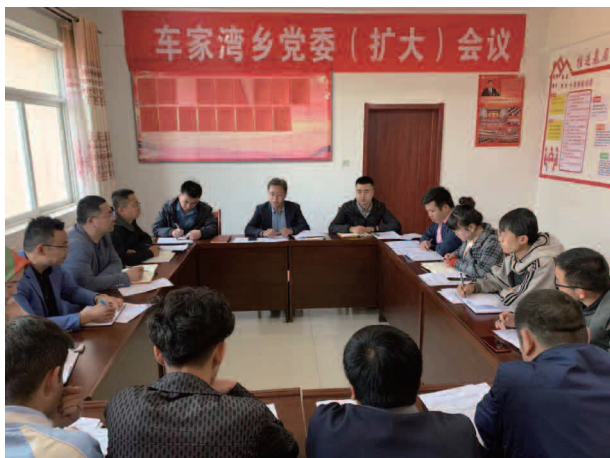
车家湾乡党委（扩大）会议

【概况】 车家湾乡辖1个行政村、5个社，47户、435人；全乡耕地面积20200.52亩，粮食作物播种面积9428亩，亩产217.93千克，总产2054.63吨；全乡劳动力222人，农民人均可支配收入7552元，农民人均占有粮921.2千克；羊存栏13406只、出栏23803只。