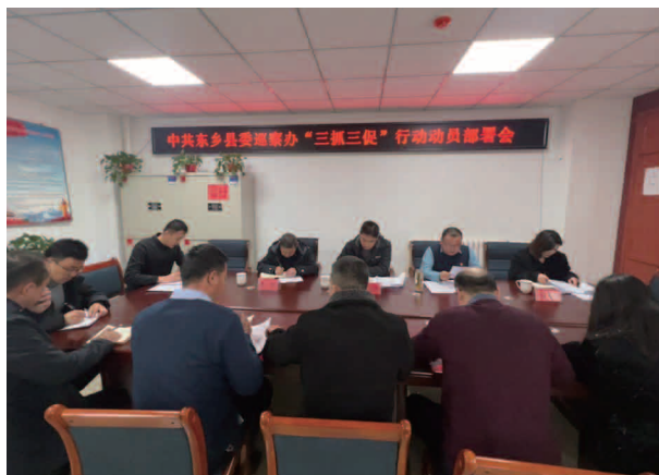
召开“三抓三促”动员部署会

把意识形态工作作为一项重大政治任务来抓，牢牢把握政治大局，认真贯彻落实党中央和上级党委的决策部署及指示精神，坚持把意识形态工作作为党的建设的重要内容，与党的建设和巡察工作紧密结合，同部署，同落实，同检查，同考核。组织全部干部通过主任办公会议、集体学习、“三会一课”、主题党日等方式，强化意识形态理论学习。召开意识形态工作专题会议 3 次，定期分析研判意识形态领域工作情况，对重大事件、重要情况、重要问题有针对性地进行引导，全力维护安定团结的政治局面；狠抓党风廉政建设，推动管党治党走向严深实。严明政治纪律和政治规矩，严肃党内政治生活，进一步细化党风廉政建设主体责任，按照领导班子分工及集体职责，认真落实党风廉政建设和工作职责双重责任，主要负责人履行第一责任人责任，狠抓党风廉政建设，组织召开主任办公会议梳理年度党风廉政建设工作要点，安排全年党风廉政建设各项工作，分析研判短板弱项，通报党风廉政建设情况，推进党风廉政建设责任落实。贯彻民主集中制，严格执行“三重一大”制度，坚持发扬党内民主，广泛征求意见建议，确保决策科学性、民主性。