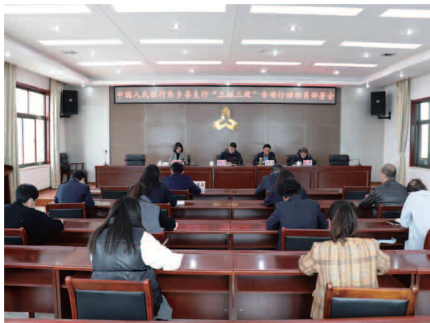
“三抓三促”专项行动动员部署会

党团结对共建（结对帮带 6 对），结对互促，共同提高。开展“牢记嘱托感恩奋进”“风华正茂青春颂党”“书香央行，阅见美好”等主题党日、团日活动，开展主题党日活动 16 次，团支部学习研讨 2 次。逐级签订《党风廉政建设责任书》，本年度纪检组长对股级以上干部廉政谈话 6 人次，廉洁交往承诺书 18 份。开展专题警示教育 2 次，纪检组长讲党性党课 2 次。