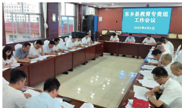
东乡县教育专责组工作会议

系、制度体系和工作机制，保证党组织在学校工作中的领导作用，全面提升中小学校党的建设水平。截至目前，全县教育系统现有党总支 4 个（东乡中学、民族中学、东乡三中、国强职校）、党支部 70 个，党的基层组织覆盖率为 100%，全系统共有党员 933 名（其中预备党员 16 名）、女党员 324 名，占党员总数的 34.73%。