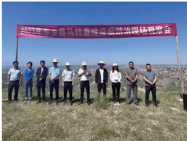
2023 年东乡县马铃薯晚疫病防治现场观摩会

【 党建工作 】组织开展党委理论学习中心组学习 12 次、习近平新时代中国特色社会主义思想主题教育集体学习 27 次、学习讨论 12 次、心得交流 4