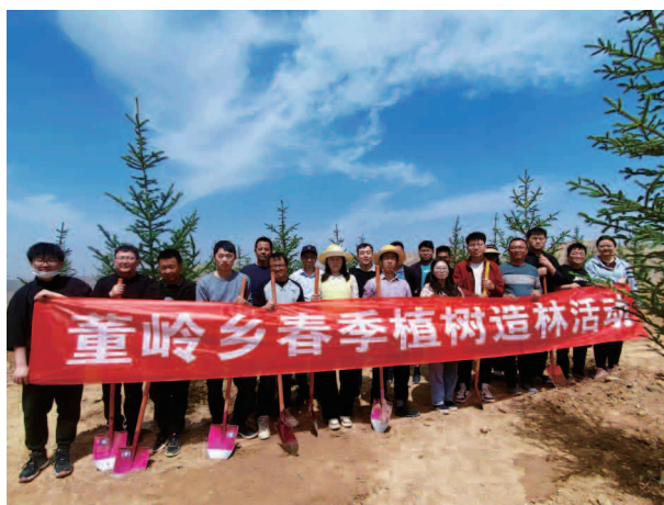
董岭乡春季植树造林活动

处，确保群众吃水不出问题。开展农村低保对象动态调整，对不符合条件的及时清退，全乡低保 372 户 1793 人，其中一类 39 户 100 人，二类 206 户 929 人，三类 101 户 607 人，四类 26 户 157 人；特困供养 20 户 24 人，事实无人抚养儿童 15 户 18 人。修缮维修改造村道 16 处 2.6 千米，各村实施农村环境整治项目，发放垃圾桶 250 个，基础面貌发生巨大变化。在祁家村修建“幸福食堂”，董家沟村设置“积分超市”等，董岭乡今年荣获第十二批州级精神文明建设先进集体。