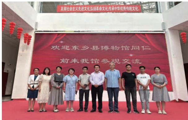
东乡县博物馆赴山丹县博物馆开展馆际交流

【展览】围绕借鉴提升思路，积极开展交流展览，先后在康乐县、积石山县、阿克塞县举办“民族团结绽芳华同心筑梦文博家——披在身上的民族文化五馆联盟少数民族服饰”“‘钱’世今生”