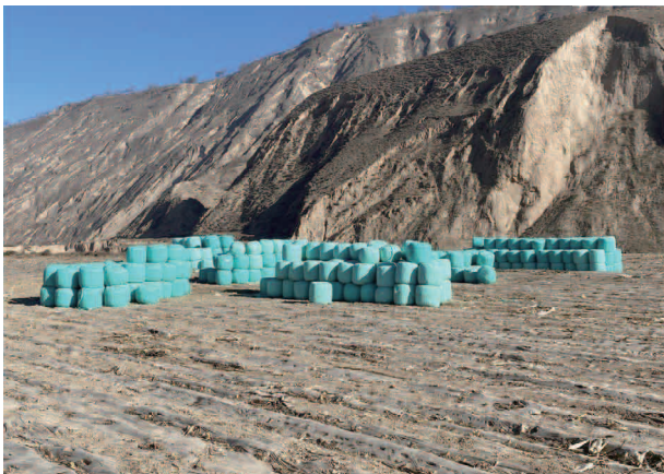
凤山乡 2000 亩旱作农业全膜双陇沟播玉米及饲草丰收入仓

燕麦 1100 亩、藜麦 110 亩。累计发放创业贷款 367 户 3634 万元、富民贷款 13 户 117 万元；鼓励和支持创业群众在外经商 46 家（其中餐饮业 22 家），带动群众 226 人就业。发挥光伏发电推动村集体经济发展，年收入 152 万元，助力全村公益事业。