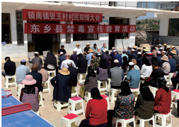
张王村村民知情大会

态清零。监测户风险累计消除 165 户 877 人，其中脱贫不稳定户 46 户 246 人，边缘易致贫户 116 户 619 人，突发严重困难户 3 户 12 人。2023 年风险消除 11 户 58 人，其中脱贫不稳定户 4 户 22 人，边缘易致贫户 4 户 24 人，突发严重困难户 3 户 12 人；三保障及安全饮水持续巩固提升。义务教育方面，全面落实各项教育扶贫政策，全镇义务教育阶段建档立卡学生，全部享受“两免一补”“三免一助”。2023 年“雨露计划”享受 181 人、27.15 万元。基本医疗方面，全镇脱贫户 2683 户 15384 人，低保户 2535 人，监测户 1113 人全部参加基本医疗保险；家庭签约 24055 人，签约率 100%，已办理慢病卡 2523 张，大病 31 人，慢四病 2983 人，均已动态管理。住房安全方面，对全镇所有脱贫户住房进行了住房安全等级鉴定，因地制宜实施农房抗震改造，全年共实施抗震改造 17 户，竣工入住 17 户。2023 年生态搬迁任务数 15 户，已摇号成功 19 户。安全饮水巩固方面，全镇自来水入户率 100%，水质达标 100%，落实水管员 24 小时动态管护机制，及时处理各类供水管道受损问题，确保群众供水安全；产业不断发展壮大。进一步调整优化全镇产业结构，种植业方面，全镇现有耕地面积 28711 亩，分别种植饲草玉米 10036 亩、紫花苜蓿 61 亩、脱毒马铃薯 16400 亩、藜麦 700 亩、金银花 101 亩、小麦 869 亩。在确保原有粮播满级提质增效的基