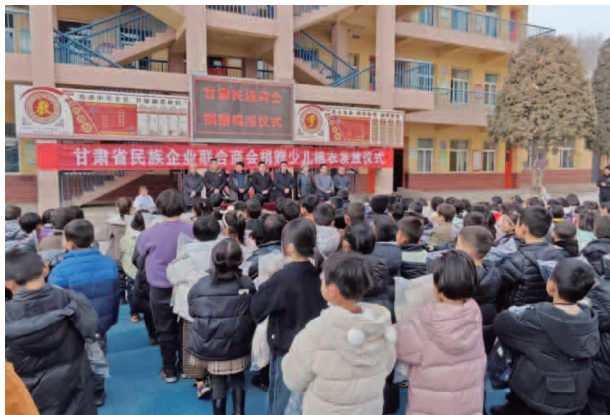
甘肃省民族企业联合会捐赠少儿棉衣发放仪式

压缩站一座，投入机械、人力、物力资金约 32 万元。推动“厕所革命”向纵深发展，完成旱厕改造 66 座，切实改善了群众厕所卫生。硬化入户道路 6 千米，投入资金 8.55 万元，定期进行乡道、村道维护，全年整治维修，抢修损毁道路、边沟 16 处，保障群众正常通行。