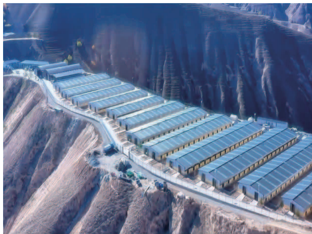
马场村万只湖羊良种繁育基地

草作物的种植面积，试种藏红花等经济作物。在拱北湾村和周杨村易地搬迁点流转土地 80 亩，改造建设温室大棚 60 座，打造现代寒旱特色农业蔬菜基地，主要种植西红柿、黄瓜、番茄等蔬菜，平均年产值达 110 万元左右，销售方面主要通过订单销售、观光采摘、礼盒直销、电商带货等方式出售，可长期提供稳定就业岗位 20 人左右，临时用工 600 人次，为村集体经济分红 10 万元左右。种植脱毒马铃薯 3.2 万亩，玉米 6400 多亩，藜麦 2200 亩，紫花苜蓿 8000 亩；发放脱毒马铃薯种薯 106.275 吨，发放藜麦种子 2000 亩，结合撂荒地整治共计流转土地 6300 余亩，提质增效土地