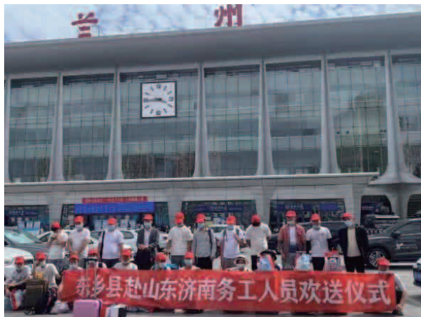
东乡县赴山东济南务工人员欢送仪式

【劳务输转】 在县委、县政府的安排部署下，将劳务产业发展任务指标层层分解下达到各乡镇村。对 23 个乡镇、村督导建立完善劳动力就业台账，做到了劳动力底数清，情况明。通过电视台、微信公众号等多种形式的媒介宣传务工信息及劳务奖补政策和就业岗位信息；开展“春风行动”“送信息、送政策”等活动，线下集中召开“暖冬行