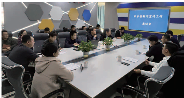
召开新闻宣传工作座谈会

印《宣传思想和意识形态工作手册》口袋书，分期举办县级领导、科级干部、乡村两级书记参加的意识形态工作专题培训4期，提高了意识形态工作在党委（党组）年度考核和综合效能考评中的权重。建立了乡镇宣传委员述职评议工作制度，全面完成十四届省委第二轮巡视中专项检查东乡县委落实意识形态工作责任制情况反馈问题。