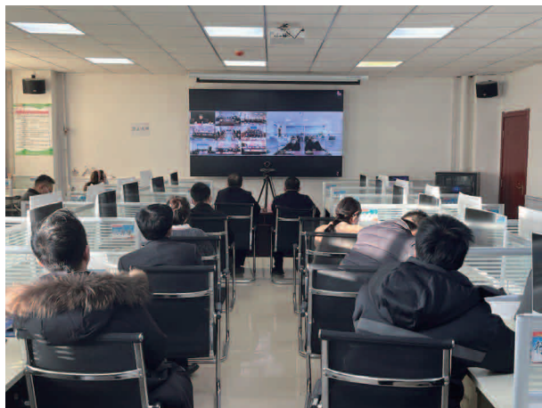
参加全省巩固拓展脱贫攻坚成果同乡村振兴有效衔接重点工作（视频）会议

目，统筹使用资金，2023 年下达财政衔接补助资金 9.4 亿元，安排项目 103 个，其中产业发展类项目 55 个，投入资金 5.64 亿元、产业占比 60%。实行项目清单化管理，施工进度周调度、资金支出日通报，严把项目论证关、施工质量关、竣工验收关，确保资金发挥最大效益，支出财政衔接补助资金 9.16 亿元、支出率 97.44%。强化帮扶资产后续管理，2013—2020 年投入各级各类资金 70.55 亿元，形成固定资产和权益类资产 58.15 亿元，已全部按程序完成确权登记和资产移交。积极谋划 2024 年国家乡村振兴重点帮扶县项目，将符合条件的项目纳入《东乡县 2024 年巩固拓展脱贫攻坚成果和乡村振兴项目库》，分解至各项目实施单位，提早着手项目前期准备工作，为 2024 年乡村振兴项目建设提供了先决条件。