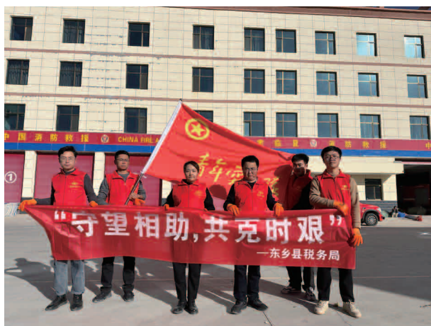
组建青年突击队到积石山抗震救灾

度，规范税收执法记录行为，完善“线上+线下”税收执法信息公示体系，落实“首违不罚”清单，运用说服教育、提示提醒等方式，深化柔性执法。坚持“谁执法谁普法”，组织全员学习《印花税法》《耕地占用税法》等税收法律，一体推进执法普法，提高依法行政、依法治税的能力和水平。持续开展自查整改，抓好专项督审，提升减税降费、组织收入、发票管理、财务管理、内控执行等重点事项督审质效。做好现金税费征缴风险数据核查，配合好外部审计，做好问题整改，持续深化“三项制度”，落实行政执法公示、执法全过程记录、重大执法决定法制审核制度，完善税务机关权责清单，严格落实自由裁量基准，促进执法公平，落实好税务行政处罚“首违不罚”事项清单。