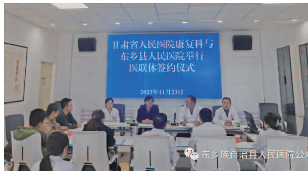
甘肃省人民医院康复科与东乡县人民医院举行医联体签约仪式

【对口帮扶】 2023 年上半年甘肃省人民医院“组团式”帮扶专家 13 名，共收治门急诊患者 1100 余人，查房 200 余次，收治住院病人 200 余人，开展讲座 50 次，讲座培训 1018 人次，开展手术 78 例，手术示教 6 例，会诊 77 人次，义诊