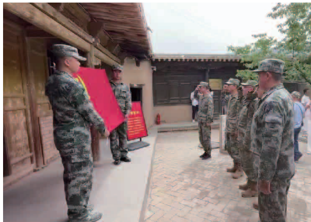
“七一”主题党日活动

【思想政治建设】深入学习宣传贯彻落实党的二十大精神，认真传达学习二十届一中、二中全会和全国“两会”精神，深入学习习主席系列讲话，全面学习贯彻习近平新时代中国特色社会主义思想和习近平强军思想，制定党委理论中心组年度学习计划和政治教育计划，狠抓工作落实，不断铸牢思想根基科学制定年度重点工作任务清单。扎实搞好主题教育，全面贯彻“学思想、强党性、重实践、建新功”的总要求，深入开展学习贯彻习近平新时代中国特色社会主义思想主题教育，坚持学思用贯通、知信行统一，开