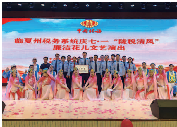
参加全州税务系统廉洁文化活动

营商环境不断优化，积极主动宣传并落实各项税收优惠政策，实现税收优惠政策全覆盖宣传辅导，确保纳税人应知尽知，应享尽享。结合税收宣传月，开展形式多样的政策宣传和申报操作培训，累计开展专场宣传活动2场，政策培训1场，发放宣传资料300余份，培训纳税人100人次。累计召开领导小组会4次，专责组会议3次，局务会议5次。2023年，为16户办理留抵退税企业，留抵退税金额297.92万元；为各类企业减税降费及办理缓税退税1903.42万元。