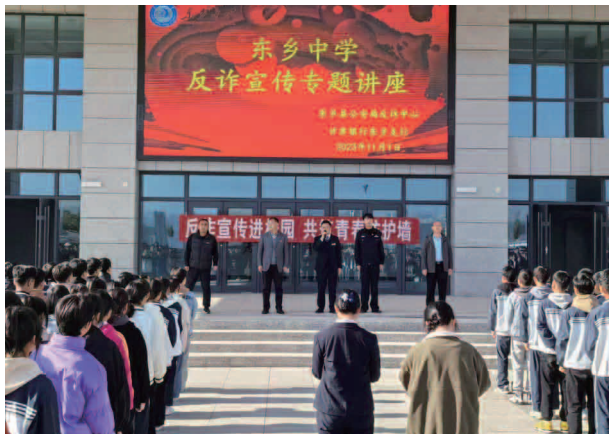
甘肃银行东乡支行到东乡中学进行反诈宣传讲座

震发生后，甘肃银行临夏分行决定成立抗震救灾青年突击队，帮助群众做好救灾工作，听闻该消息后一向热衷于公益事业和志愿服务的东乡支行员工第一时间毅然决然报名参加，做为志愿者驰援积石山抗震救灾重建家园的一份子。到达灾区后，青年突击队被安排到积石山县吹麻滩方家村协助政府工作人员开展工作，便主动挨个到帐篷与受灾群众接触，了解他们的困难和需求，询问他们的生活情况，给予他们精神上的支持和鼓励，努力传递希望和信心，让他们感受到政府和社会的关心、温暖。