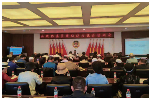
县政协委员履职能力提升培训会

【重点工作】 主席会议成员落实县级领导包抓乡镇和“大村长”工作职责，协调解决乡镇、县直有关部门在巩固拓展脱贫攻坚成果同乡村振兴有效衔接、两费收缴、环境整治、小额信贷回收、生态及地质灾害避险搬迁安置等工作中存在的困难和问题，提出促进和规范工作的意见建议，推动县委、县政府决策部署的贯彻落实。常态化深入包抓企业、学校，一线调研、实地督导，聚焦利益诉求，解决实际问题。