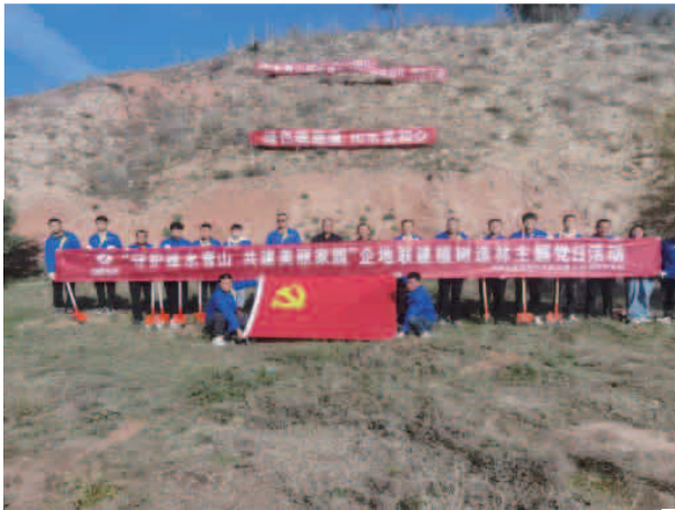
“守护绿水青山 共建美丽家园”企地联建植树造林主题党日活动

低保 28 户 168 人；事实无人抚养儿童为 21 户 40 人；孤儿为 3 户 3 人；集中供养儿童 1 人，分散特困供养户为 22 户 36 人。