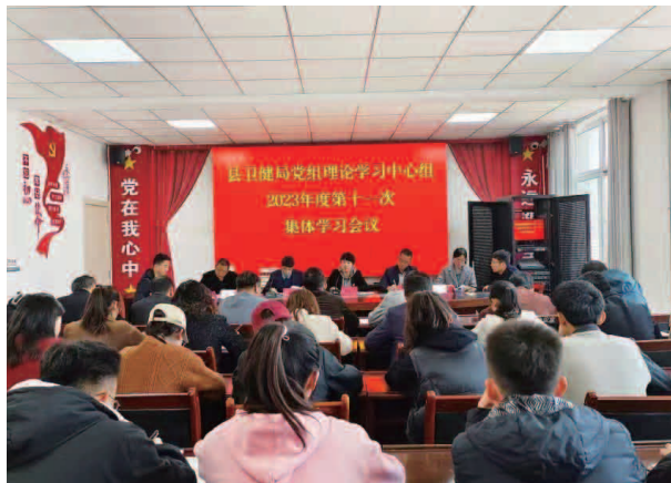
党组理论学习会议