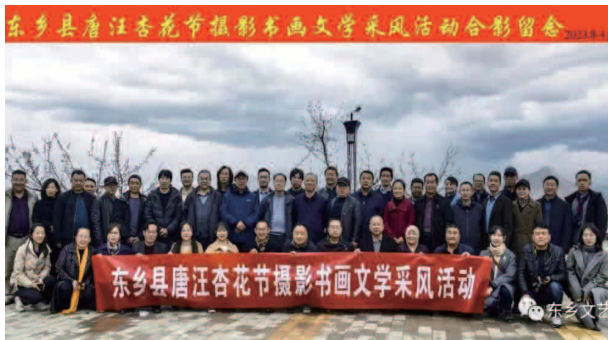
东乡县唐汪杏花节摄影书画文学采风活动

字，通过乡村干部分发给河滩、唐汪两镇的群众家中，通过送文化送春联送福字的方式，把对新春的祝福送到了人民群众家中，受到了农民群众的普遍欢迎。年初由县文联牵头，联合县文化馆、洮河文化公园服务中心及甘肃省东乡文化研究会，在位于达板经济开发区的洮河文化公园服务中心，举办“牢记嘱托感恩奋进”为主题的摄影书画展，共展出摄影、书画精品力作 210 幅余，从不同角度、不同形式反映了习近平总书记视察东乡十年来东乡大地发生的翻天覆地的变化，展现了东乡县十年来取得的新成就、新气象，受到了前来观展的广大群众和各界人士的一致好评。2 月上旬，在布楞沟村史馆举办了为期 30 天的“多彩东乡、逐梦未来”主题摄影展，从征集的 600 余幅摄影作品中，精选 144 副摄影作品，以摄影家独特视角诠释全城乡新貌、经济发展、社会民生、民族风情和文明风尚，以光影艺术展现“八有八美”东乡的新变化、新风貌、新进步。4 月上旬，在“花儿临夏·在河之州”临夏州第二届文化旅游节——2023 年东乡县唐汪杏花旅游系列活动期间，由县文联主办，联合唐汪镇、县文化馆、洮河文化服务中心，邀请和组织州县摄影家协会、美术家协会、书法家协会、作家协会的 80 多名艺术家，在唐汪镇成功举办唐汪杏花摄影书画创作笔会活动，艺术家们以东乡自然景观，风土人情为主题和素材，深入唐汪镇各旅游景点、丹霞地貌、山顶谷地、田间地头、洮河沿岸等地，用镜头和画笔记录唐汪川自然美景和风土人情，开展