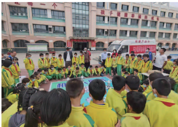
幸福小学开展科普进校园活动

书籍 16 种 1100 多册，科普宣传品 80 多个，受宣传咨询影响的群众 1600 多人次。