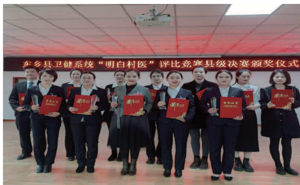
东乡县卫健系统“明白村医”评比竞赛县级决赛颁奖仪式

配合村“两委”做好驻村各项工作；为驻村帮扶工作队购买人身意外伤害保险，价值近万余元的煤炭、米面油等生活物资，配备电脑、打印机、办公桌、床铺等用品，定期进行走访慰问。印制发放《基本医疗有保障应知应会手册》1000 册，举办卫健系统健康帮扶工作专题培训会 7 期，组织开展健康帮扶知识测试 2 次；举办以“熟悉村情知业务，立足岗位做奉献”为主题的“明白村医”评比竞赛活动，倒逼村医对村情、业务政策、工作内容、服务对象做到“一口清”。