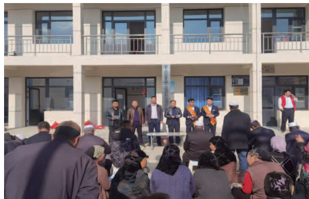
甘肃银行东乡支行到大树乡南阳洼村进行贷款宣传

【抗震救灾】积极践行社会责任，以实际行动为民办实事，2023年12月18日积石山6.2级地