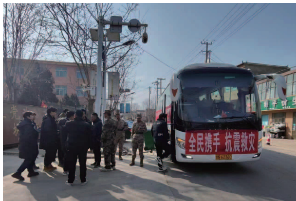
乡基干民兵前往积石山参与抗震救灾

数10336人，累计办理城乡居民慢特病卡1196张，办理城乡居民“两病”门诊待遇保障卡447人。患大病患者398人，均已享受医保部门的基本医疗保险报销、大病保险报销，低收入人口均享受医疗救助和依申请救助。农村低保户527户1948人（其中一类43户104人、二类377户1232人）；特困供养户18户26人、事实无人抚养儿童共21户32人、重度残疾294人。生态及地质灾害避险搬迁对象计划搬迁46户，公示搬迁48户，其中县外搬迁24户，县内搬迁24户（安置点12户，楼房搬迁12户）。完成旱厕改造142座。十改一拆三建共计改造593户，涉及资金368.142万元，主要项目有屋面改造，大门，围墙，厨房改造，庭院硬化等，涉及6个村，全部改造完成通过验收。