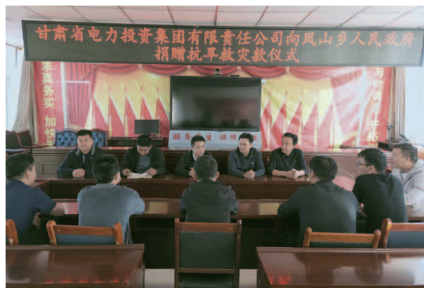
省电投帮扶项目实施座谈会

【防返贫监测】 加强“三类户”常态化监测，先后 3 次组织乡村社干部对全乡重点人群、重点区域、帮扶成效、风险消除稳定性等进行集中排查。通过“一键报贫”申报“三类户”59 户 143 人，新识别纳入 7 户 46 人；遍访“三类户”、一二类低保户、特困户，落实“三类户”帮扶措施 190 项，户均落实 2.3 项。