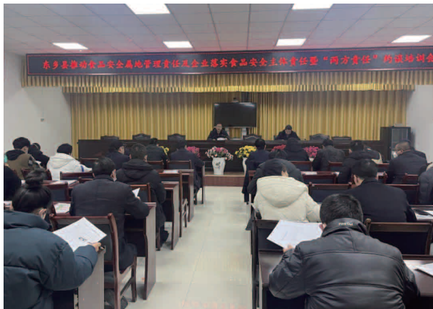
食品安全主体责任暨“两方责任”约谈培训会

网+监管”监管工作，开展“双随机、一公开”监管工作，制定单部门和跨部门随机抽查实施细则，及时认领抽查事项清单462项，建立监管对象库118个，监管人员库117个，全县共开展单部门双随机73批次，检查市场主体432户，移动端APP使用率93.29%，转案源一起，开展跨部门双随机19批次，检查市场主体423户，移动端APP使用率90%，累计录入行政检查信息2908条、行政处罚信息81条，其它行为信息1310条，发布监管动态信息446条、监管曝光台信息53条，发布工作通知32条。推进涉企信息归集共享工作，全县累计归集各部门行政许可信息35460条、行政处罚信息14条、小微企业扶持信息26条，市场监管部门共享市场主体信息15681条，其中企业及农民专业合作社信息1608条，个体工商户信息5028条，变更信息2335条，简易注销公告336条，简易注销结果242条，认真落实《失信企业协同监管和联合惩戒合作备忘录》，列入经营异常名录282条次，严重违法失信企业名单信息1条，经营异常状态5850条次，加快建立健全各相关部门的信息归集，建立以信用为基础的监管模式，形成有效的守信激励和失信惩戒机制。持续开展公平竞争审查工作，组织召开2023年东乡县公平竞争审查联席会议和公平竞争审查工作推进会，督促指导各成员单位进一步提高公平竞争审查意识、提高公平竞争审查质量，抓好各自领