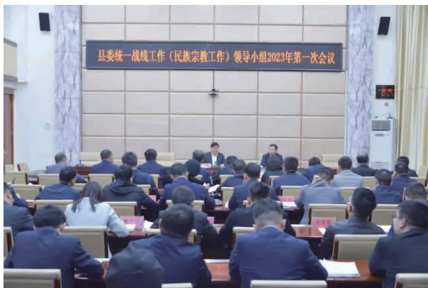
县委统一战线工作《民族宗教工作》领导小组 2023年第一次会议

我国宗教中国化方向好经验好做法。通过广泛深入开展宣传培训，提升了广大统战干部和统一战线成员的政策知晓率和思想认识水平，使铸牢中华民族共同体意识在各民族干部群众中深入人心、家喻户晓，进一步铸牢了中华民族共同体意识和思想根基；靠实工作责任，推动工作落实。坚持把推动工作落实作为贯彻落实党的二十大精神和党的民族宗教政策的出发点和落脚点，在广泛学习宣传的基础上，坚持问题导向，深入分析全县民族宗教工作形势，健全完善了县委统一战线工作（县委民族宗教工作）领导小组，制定印发了《中共东乡县委统一战线工作（县委民族宗教工作）领导小组工作规则》等，进一步明确工作任务，细化工作措施，靠实工作责任，狠抓工作落实，确保党的民族宗教政策落到实处，推动中央、省委、州委关于民族宗教工作的一系列部署要求在东乡落地生根。