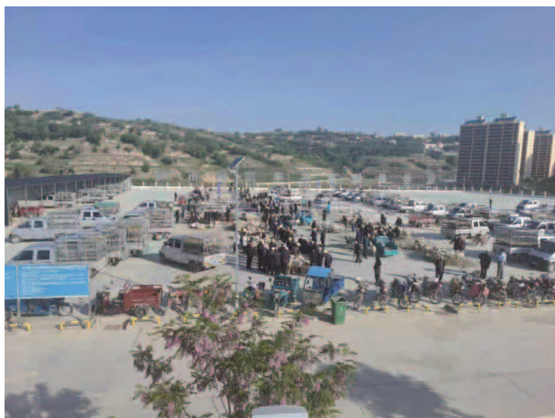
锁南牛羊交易市场