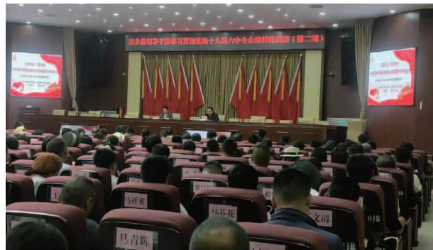
东乡县领导干部学习贯彻党的十九届六中全会精神培训班（第二期）

【机构】 中共东乡县委党校属全额财政拨款并拨付的事业单位。占地12亩，党校现设综合办公室、教务培训处、党建理论教研室、图书资料室、科研室等5个股室和理论宣讲培训中心。共有教职工17名，其中研究生2名，本科9名，大专4名，中专2名，中共党员9名。