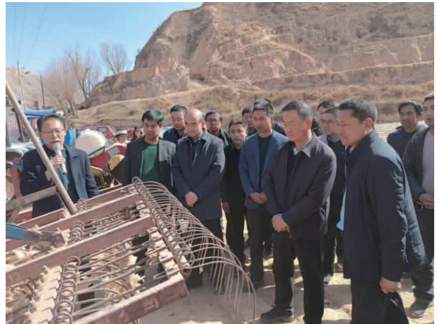
旱作农业顶凌覆膜现场

3000元，每亩净收入在2000元以上，收益群众4500余户。藜麦种植方面，以布楞沟流域乡镇为主，通过中石化帮扶“订单种植收购”方式，推广种植藜麦1万亩，由中石化按照6元/斤的保护价进行收购，预计收益农户4800余户，户均增收1800元，保障群众利益。