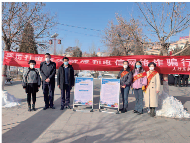
开展打击电信网络诈骗宣传活动