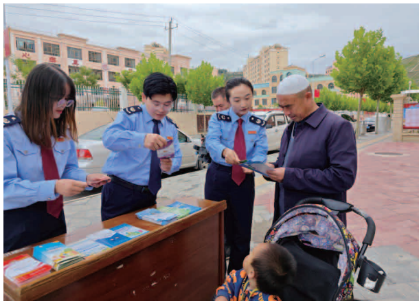
宣传税费优惠政策

【依法治税】 营税收法制水平不断提升，认真学习贯彻《关于进一步优化税务执法方式的意见》，营造浓厚法治氛围。推进领导述法、党委会学法、干部学法制度化，大力推进税收法治建设，全面推行行政执法“三项制度”，认真落实权责清单制