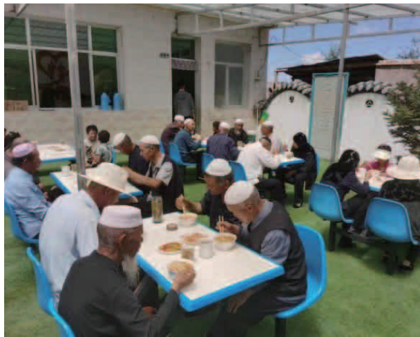
开设“幸福食堂”，让老人、儿童享受家门口的“幸福滋味”

务“规范完善临夏地质公园范围内的村规民约”的要求，对 7 个乡镇涉及的 72 个村（社区）村规民约进行了修订。尤其是对东塬乡林家村、河滩镇祁杨村两个临夏世界地质公园科普社区村规民约进行上墙展示；按照省州要求，指导乡镇对全国基层政权建设和社区治理信息系统本年度需填报和完善事项进行更新完善，更换了 17 个基层群众性自治组织特别法人统一社会信用代码证书。社会组织发展逐渐认可。坚持党对社会组织管理工作的全面领导，健全社会组织党建工作管理机制和工作机制，推进全县社会组织党的组织和党的工作全覆盖，发挥好社会组织党组织和党员的作用。全县登记社会组织 213 家（民办非企业 13 家），其中正常运行的社会组织 23 家（含 13 家民办非企业），其余 186 家社会组织为村级产业发展互助社。全县社会组织中共有 6 个党支部（其中，单独组建 2 个、联合组建 4 个，共覆盖 17 个社会组织，党组织覆盖率为 73.9%），现有党员 22 名，预备党员 2 名，入党积极分子 6 名。工作中注重东西部协作帮扶活动，通过东乡县民政局积极与历城区民政局对接协调，组织 6 名干部赴济南开展培训和项目协商。9 个社会组织与东乡县 12 个村达成帮扶协议。落实帮扶资金 21 万元。