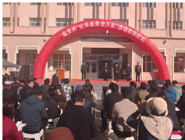
临夏州“社保服务进万家”活动启动仪式

人，已缴费 5.47 万人，缴费率为 66.08%。共享待遇 37022 人，共发放 563.6 万元。