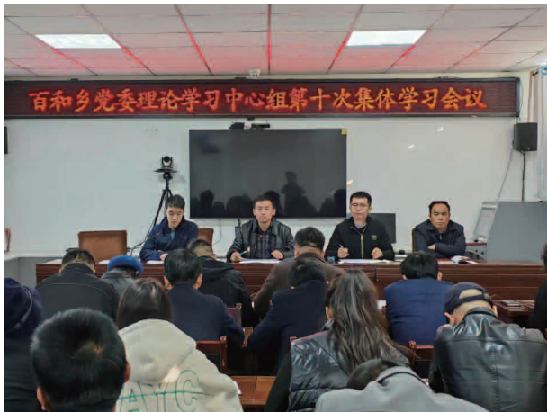
百和乡党委理论学习中心组第十次集体学习会议

总产 6633.75 吨；全乡劳动力 5479 人，农民人均可支配收入 7524 元，农民人均占有粮 623.3 千克，农机总动力 8600 千瓦；羊存栏 29753 只、出栏 67799 只；有小学 9 所，专任教师 52 人，在校学生 1496 人。