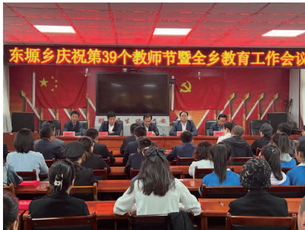
召开庆祝第 39 个教师节暨全乡教育工作会议

农机总动力 7519 千瓦；羊存栏 28053 只、出栏 38975 只；有小学 8 所，专任教师 52 人，在校学生 1109 人。