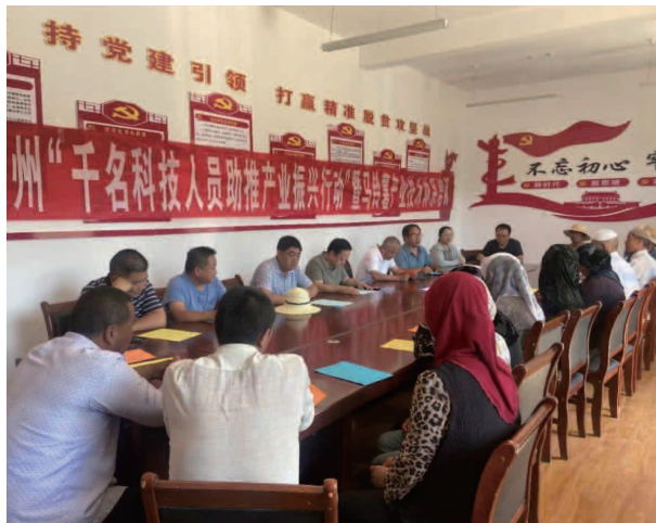
千名科技人员助推产业振兴行动

【农机安全生产】 在监理系统中录入各种型号拖拉机 49 台，注册登记拖拉机驾驶证 48 人，期满换证 2 人，举办驾驶员培训班 3 期，培训驾驶员 80 人次，在田间地头培训 12 次，参加培训