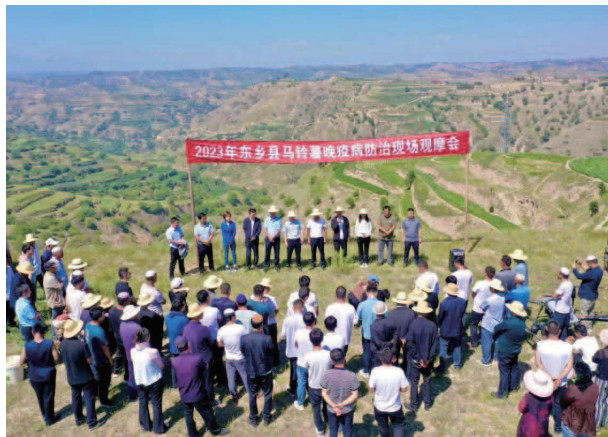
2023 年东乡县马铃薯晚疫病防治现场观摩会

【产业发展】 推广“支部引领、党员带头”，“养殖+合作社+劳务+乡村就业车间”的“2+4”