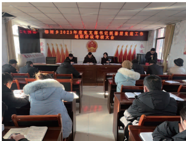
2023年度党支部书记抓基层党建工作述职评议考核大会

享受奖补资金199万元；共计奖补资金664.28万元，是全县唯一一个完成养殖示范乡镇奖补资金500万元的乡镇。有劳动力3576人，外出务工1783人（脱贫人口劳动力1541人，外出务工902人），完成“点对点”劳务输转96人，落实第三地外出务工劳务奖补4人2万元，落实交通补贴429人22.23万元。开发公益性岗位127人，省级61人，光伏66人。