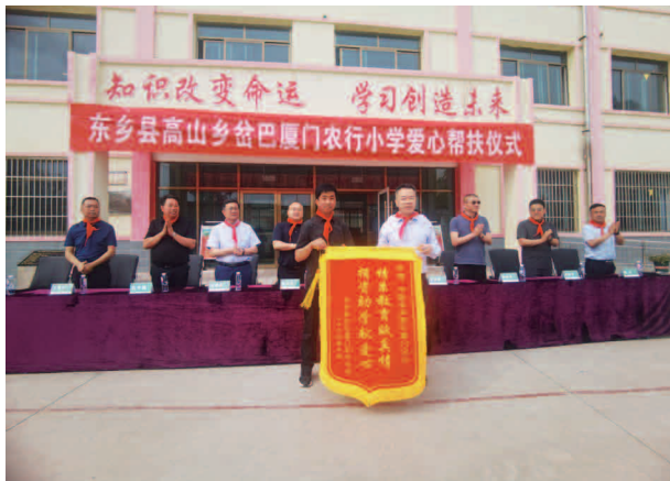
高山乡岔巴厦门农行小学爱心帮扶仪式

数据治理和加快投放三项措施，支行普惠贷款余额（监管口径）1.4亿元。推进农户信息建档，已建档行政村179个，比年初增加27个；已建档农户5049户，比年初增加1361户，增量居全州第1位；完成移动端农户信息4943户，增量居全州第1位。在全县23个乡镇，布放惠农通24个，覆盖率100%；乡镇开通服务点60个，服务点电子机具月均金融性交易笔数26笔，月均金融性交易金额1.5万元，排名全州第4。共发放农户贷款1876笔1.36亿元，余额达到1.5亿元（其中：惠农e贷（富民贷）1192笔9135万元，存量余额达到1.01亿元，农户小额贷款（线下）680笔，余额4235.5万元）。选派3名干部在高山乡岔巴村常年驻守帮扶，一对一对接帮扶2户低保困难户；为高山乡岔巴学校师生捐赠5万元学习生活用品，向低保困难户送去生活慰问品并协助购买农用机具，村两委建设方面提供帮扶资金2万元。调查处理客户反映的征信异议及问题贷款，对清单中104户问题贷款进行债务落实及征信恢复申请，处理完成87户。