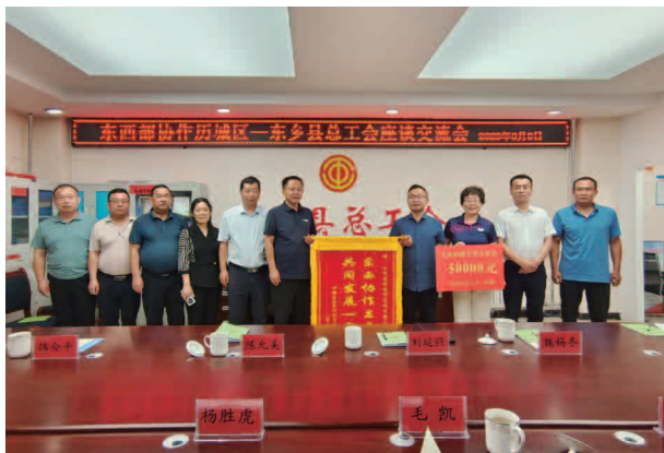
东西部协作历城区——东乡县总工会座谈交流会

【机构】县总工会内设综合办公室、劳动关系和社会联络室、财务和资产管理室3个股室，现有工作人员17名。