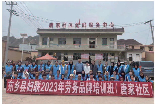
东乡县妇联2023年劳务品牌培训班

女儿童为主要工作对象，将禁毒宣传工作嵌入妇女儿童权益、家庭教育、家家幸福安康工程工作中。