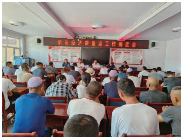
沿川经济带重点工作调度会

有效增强群众的法制意识和普法知识掌握率。同时，以新时代文明实践志愿服务活动为载体，通过“法律明白人”持续开展法治宣传活动，为群众提供法律咨询，指引法律服务，参与矛盾纠纷化解，有效确保了群众安全感和满意度的双提升。