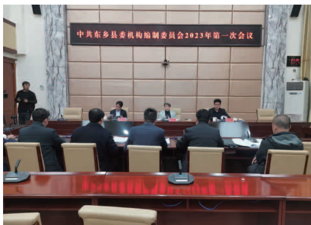
中共东乡县委机构编制委员会年第一次会议

县直行政编制 367 名（不含政法）、政法专项编制 170 名、乡镇行政编制 451 名；全县共有各级各类事业机构 481 个，其中正科级以上 2 个，正科级机构 146 个，副科级机构 165 个，共核定各类事业编制 7076 名，其中全额拨款事业编制 7025 名，差额拨款事业编制 30 名，自理编制 21 名；全县共核定工勤编制 120 名。全县共核定领导职数 1199 名，其中正县级 4 名，副县级 28 名，正科级 318 名，副科级 849 名。实名制系统中现有登记在册人员 8835 名，在编在岗 8795 名，在岗不在编 40 名。