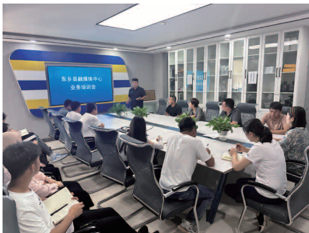
东乡县融媒体中心业务培训会

【机构】 东乡县融媒体中心内设办公室、总编室、新闻中心、新媒体部、节目中心、技术保障部6个机构。共有工作人员共计42人，设主任1名，副主任2名。