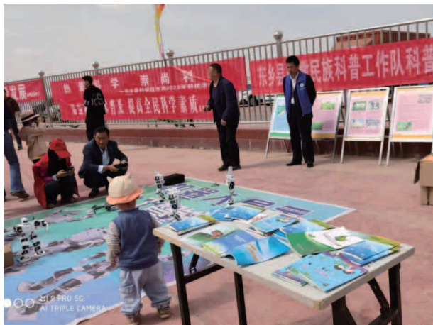
开展科技周科普活动

【机构】东乡族自治县科学技术协会内设办公室、青少股、组宣股、学会股，核定编制为19名。2023年，共有工作人员18名，其中主席1名，副主席2名。