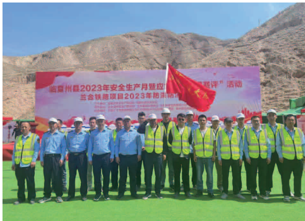
临夏州县 2023 年安全生产月暨应急管理“竞赛评”活动

重点领域，坚守安全生产基本盘。推进重大事故隐患专项排查整治 2023 行动，将重大隐患排查整治工作作为压实企业主体责任、部门监管责任和地方党政领导责任的着力点，加强日常调度、责任倒查、精准执法，推动风险隐患真查真改真销案。截至目前，各乡镇各有关部门累计开展安全生产检查 3523 次，检查场所（企业）4196 家次，排查隐患 9803 个，完成整改 9803 项。督办重点突出问题，坚持每季度对安全生产领域重点突出问题实行督办，自 2023 年初以来，已督办省、州安委办反馈重点突出问题共计 106 条。统筹推进县、乡、村三级公共安全教育培训，深入乡镇、部门、重点企业广泛开展应急科普宣传，营造全社会学法、守法、遵法、用法的法治氛围。2023 年，共宣讲 16 场次，受众 1800 余人；组织开展“5.12”防灾减灾宣传周、“5.12”防灾减灾日系列宣传，围绕“人人讲安全、个个会应急”安全生产月主题，扎实开展辖区内、系统内、行业领域内“安全生产月”系列活动，组织县应急、地震、科技、气象、自然资源、水务等部门集中开展“10.13”国际减灾日宣传活动。发放宣传资料约 8000 余份，悬挂宣传横幅 140 余条，开设知识讲座 20 场次，开展应急演练 20 场次，进一步提升社会公众防灾避险知识和自救互救能力。