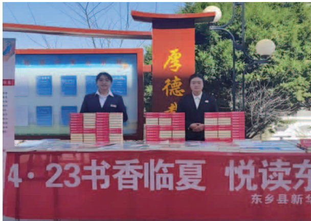
4·23 读书日开展流动售书活动

【机构】东乡族自治县档案馆与县档案事业管理局合署办公，实行局馆合一，一个机构，两块牌子，内设办公室、业务指导股、安全保卫股、信息股4个股室。县档案馆人员编制为16人，干部职工19名。主要职能是：负责接收和征集本区域内各机关、团体、企事业单位及其他组织的具有保存价值的档案以及有关资料，实行科学管理，开展档案资料的开发利用。