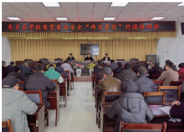
学校食堂食品安全“两方责任”约谈培训会

安排部署，组建工作专班，细化工作方案、明确工作任务、实施步骤和责任要求，推进工作任务落实，止年底，已对我县 1352 户食品生产经营企业和 452 名包保领导干部实施分层分级（A 级企业 6 户、B 级 58 户、C 级 209 户、D 级 1081 户），建立了相关台账，包保干部与企业层级对应绑定完成率 100%，完善了“三清单一承诺”（责任清单、任务清单、督查清单，责任与任务承诺书）制度，将食品安全责任和任务压实到部门（单位）、落实到个人，配备食品安全总监 90 人、食品安全管理员 1346 人，同时，加大摸排清理，累计删除一址多证、空壳、僵尸、已注销等企业 320 户，坚持效果导向和底线思维，各级党政领导干部对照任务清单深入食品生产经营场所，通过交流询问、查看台账、现场检查等方式详细了解食品生产经营单位原料采购、进货查验、食材储存、人员管理等企业主体责任落实情况，督导企业进一步完善食品安全管理制度，落实“日管控、周排查、月调度”工作机制，紧盯食品安全全流程、各环节，定期对食品安全状况进行自查，全面排查风险隐患，不断提升食品安全管理水平，止年底，全县县乡两级党政领导、村（社区）两委完成 2023 年第一、二、三季度督导工作，督导包保主体覆盖率达 100%，建立督查组和督查任务，累计督查市场主体 1363 户。深入推进智慧监管，大力推广“陇上食安”一体化食品安全智慧监管平台的运用，全县食品生产环节“互联网+透明车间”应接入 35 户，已接入 31 户，实施率为 88%，电子追溯平台应用率为 91%，流通环节“互联网+阳光仓储”应接入 82 户，已接入 80 户，实施率为 98%，“甘肃省食品安全综合监管（大数据）平台”应用率为 100%，餐饮环节“互联网+明厨亮灶”学校食堂（托幼机构）实施率 100%，中型及以上餐饮服务单位、学校食堂 100% 使用电子追溯系统，2023 年开展网上巡查 1025 户次，开展记分管理 988 户次，实现风险分级评定 683 户。持续整改落实省级食品安全第三方评估组反馈问