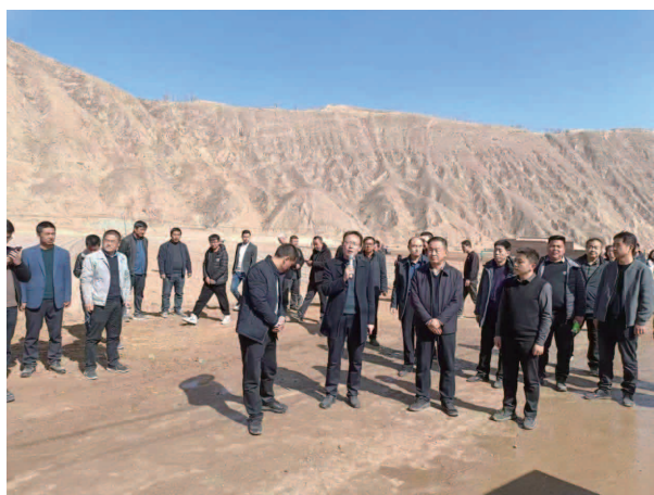
旱作农业顶凌覆膜现场会

【返贫监测工作】县农业农村局始终把巩固脱贫攻坚成果同乡村振兴有效衔接作为最大的政治任务 and “一号工程”，积极落实各项奖补政策，种植业落实产业奖补政策 2096 万元，其中，监测户 904 万元、2630 户，养殖业产业奖补落实 2780 万元，其中，监测户落实 184 万元、732 户；同时，重点围绕实施的牛羊达标提升、马铃薯种植、藜麦种植等到户产业项目，建立重点项目联动带农机制，通过龙头企业、合作社带动，建立起“龙头企业 + 合作社 + 农户”的利益联结机制，加大监测