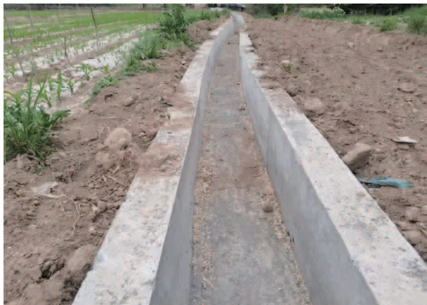
东塬乡移民村基础设施应急维修项目

已招标，计划 2024 年初开工建设；东乡县折达路沿线环境综合整治提升及产业发展项目——折达路沿线旅游大通道基础设施提升改造工程，因冬季封冻期暂停施工，计划 2024 年初复工，预计 4 月底竣工；电灌电费补助项目，按月拨付。600 元后期扶持资金 2103.6 万元，包括直补资金 847.92 万元，生产资料补助 311.14 万元，后扶项目资金 944.54 万元，后扶项目 7 个（董岭乡高咀村农业提灌维修工程投资 99.44 万元、唐汪镇水利设施水毁修复工程投资 185 万元、河滩镇祁杨村库岸维修工程投资 32.3 万元、考勒乡三塬村水毁道路应急抢修工程投资 73.62 万元、东塬乡移民村基础设施应急维修工程投资 52.37 万元、刘家峡大桥东侧面山绿化美化项目投资 321.71 万元、唐汪镇舀水村达柴山绿化上水工程投资 180.1 万元），已全部完工，正在开展审计验收等后续收尾工作。第二批省上下达资金预算 1030 万元，计划建设河滩、东塬、唐汪 3 个乡镇，团结村、东干村等 7 个移民村道路硬化项目，正在开展勘察、设计、招标等前期工作。