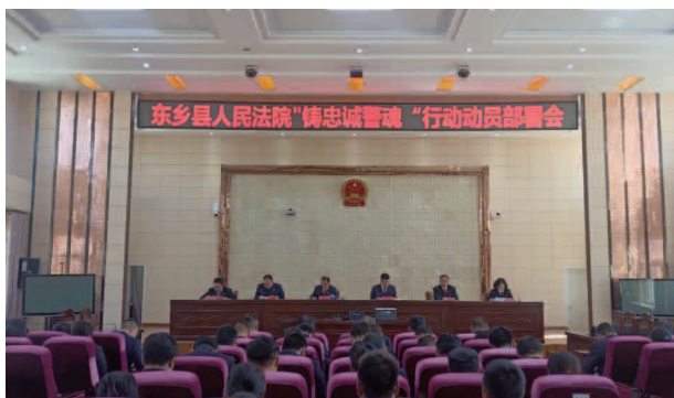
东乡县人民法院召开“铸忠诚警魂”活动 动员部署会

【执行工作】 严格落实《最高人民法院关于进一步落实“四讲四改”，巩固深化执行领域突出问题专项整治成果活动》的要求，大力推进执行规范化建设，全面落实“一案一账号”案款管理制度，健全网络查控系统、联合惩戒体系、网络司法拍卖等机制。受理当事人申请执行案 1165 件，执结 912 件，执结率 78.28%，申请执行标的 1.872 亿元，执行到位标的 8001.38 万元，执行到位率 42.74%，保全率为 20.63%。纳入限制高消费 396 人次，纳入失信被执行人 379 人次。司法拘留 47 人次，临控 376 人次，发布悬赏公告 6 人次，网络司法拍卖案件 2 件，车辆 1 辆，拍卖价款总计 3.85 万元；事项委托期限内办结率为 96.43%，平均办理天数为 4.28 天。