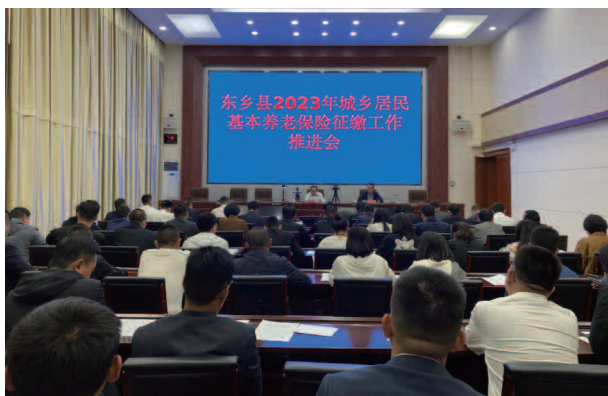
东乡县 2023 年城乡居民基本养老保险征缴工作推进会

【机构】东乡族自治县社会保险中心是隶属于东乡族自治县人力资源和社会保障局的二级事业单位，社保中心下设综合办公室、财务股、机关股、城乡股、工伤股、失业股、企业股 7 个股室。有工作人员 36 名，其中主任 1 名，副主任 2 名。