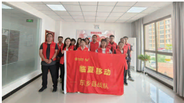
临夏移动东乡县战队

县分公司设锁南、达板、百和、龙泉、河滩、那勒寺 6 个网格，在县城设民族营业厅 1 个。公司共有员工 32 名，内设机构融合团队 12 人，政企行业团队 8 人，