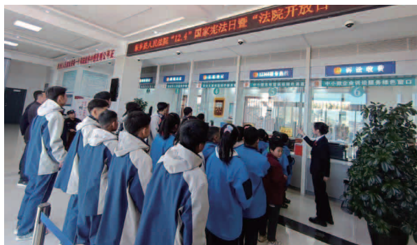
东县人民法院举行“12·4”国家宪法日暨“法院开放日”活动

【刑事审判】 按照总体国家安全观的要求，全面落实以审判为中心的刑事诉讼制度改革，常态化推进扫黑除恶斗争，重拳打击黑恶势力犯罪和抢劫、强奸、故意伤害等严重侵犯公民人身权利、财产权利的暴力犯罪，严厉打击重大安全事故、危险驾驶等危害公共安全的犯罪，落实宽严相济、罪刑法定、疑罪从无等原则。认真开展电信诈骗、养老诈骗等专项活动，营造强大震慑力，增强人民群众安全感。共受理刑事案件 120 件，结案 98 件，结案率 81.67%。