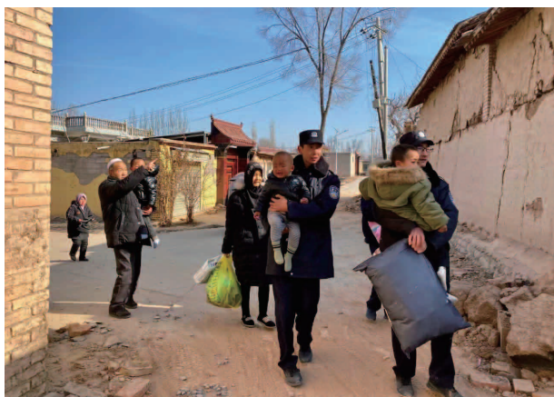
组织突击队奔赴积石山参与抗震救灾

员 280 名。全县共划分警务区 75 个、配备社区民警 189 名，社区警务辅助人员 261 名，建立警务室 42 个，“一村一警”实现了全覆盖。26 个智慧安防小区建设项目全面建成并纳入公安视综平台。刑事科学技术室一期和物证保管室、网安作战室等一批项目相继建成，有力支撑了公安工作需要。