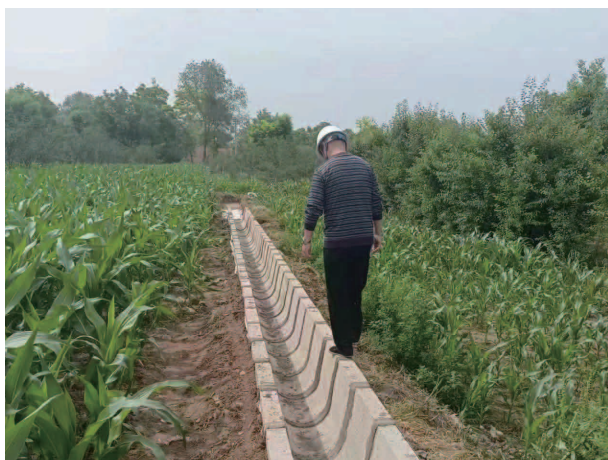
河滩镇汪胡村渠道衬砌

湖生态。将河长制工作列为县委县政府重点工作，召开河长制工作会议专题研究推进。不断调整完善组织体系，落实县级河长着重牵头“抓”，乡、村河长突出“管”“保”的河长制管理机制，及时对换届后的乡镇河长进行调整，确保责任不脱节、任务不断档。充分发挥已建“智慧河长平台”，线上巡河 67 次，县乡村三级河长累计巡河 12707 次，完成情况占全年巡河任务的 154.51%，从源头上解决河湖问题，及时实现了县域内“河湖四乱”问题动态清零。同时成功申请创建东乡县洮河达板镇（达板电站至八丹沟段）为 2023 年省级美丽幸福河湖，通过持续的工程建设各河湖长制体系建设，努力改善全县河湖生态，营造良好的河湖管理氛围。