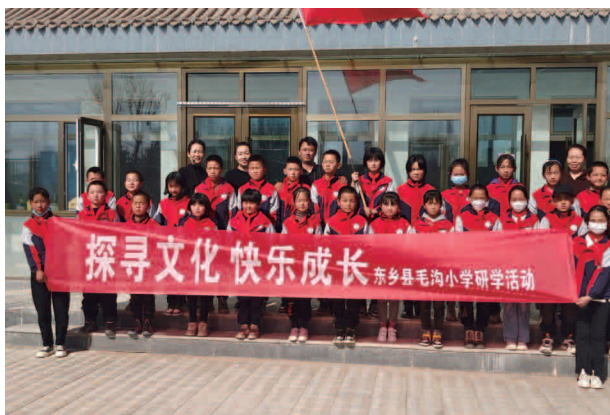
探寻文化快乐成长，东乡县毛沟小学研学活动

【机构】东乡县林家遗址文物保护研究所内设办公室、政策宣教室、研究资料室、规划建设室和安全保卫室。核定编制 13 名，有工作人员 17 名。