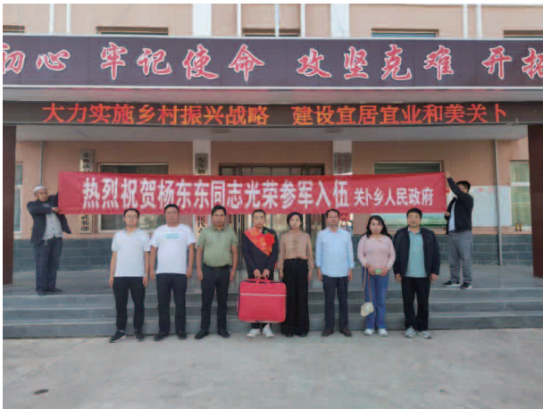
欢送有志青年入伍

【概况】 关卜乡辖9个行政村、52个社，1728户、8235人；全乡耕地面积22759.95亩，粮食作物播种面积16850亩，亩产328.61千克，总产5537吨；全乡劳动力4200人，农民人均可支配收入7614元，农民人均占有粮676.4千克，农机总动力9264千瓦；羊存栏31575只、出栏38855只；有小学9所，专任教师73人，在校学生1062人。