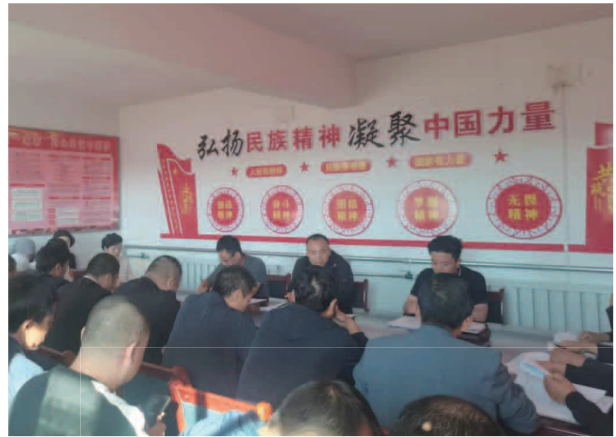
畜牧中心召开干部作风整顿动员部署会议

【动物疫病防控】 实施了防疫体系及应急储备设施建设项目，对县级动物实验室、乡畜牧兽医站和村防疫兽医室进行了化验冷藏等设备配置，完善了服务功能；肉羊研究中心全面建设完成，投入使用；通过专业技术人才引进等渠道招录了13名（其中2023年3名）专业技术人才，充实和加强畜牧技术力量；继续从养殖大户、合作社负责人等懂技术、会管理、有经验的“土专家”