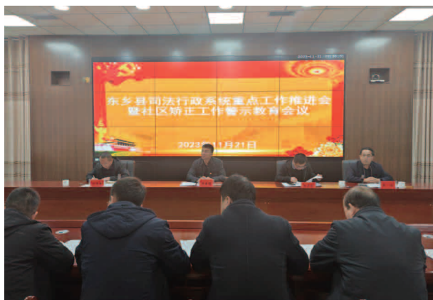
东乡县司法行政系统重点工作推进会暨社区矫正工作警示教育会议

放宣传品6万余份，受教育人数达10.5万人。依托甘肃“法律明白人”网校，深入开展“法律明白人”培训工作，全县209个行政村（社区）共注册“法律明白人”1094人。五是高效服务地方立法。今年以来对《临夏回族自治州供热用热条例》《甘肃省临夏回族自治州花儿保护传承条例》《甘肃省临夏回族自治州人民代表大会及其常务委员会立法条例》《临夏回族自治州城市机动车停车管理条例》进行了意见征求，及时上报了反馈法律法规草案修改意见。