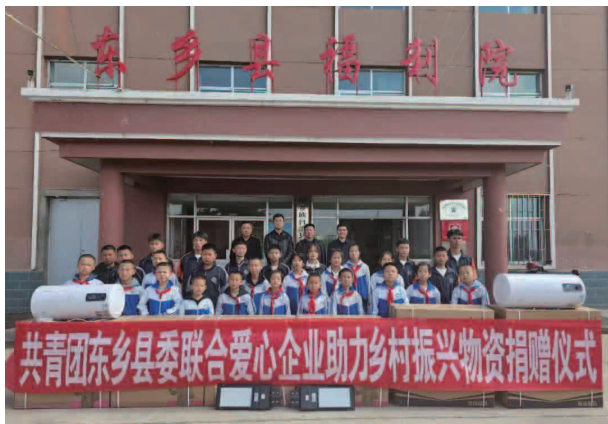
共青团东乡县委联合爱心企业助力乡村振兴物资捐赠仪式

份组织东乡县 26 名团代表参加共青团临夏州第十四次代表大会；6 月份组织召开了基层团组织书记述职评议会议，组织基层团组织对各自工作梳理总结，展示和交流先进、特色工作方法，互通有无，互促互进；夯实工作力量，根据县域共青团基层组织改革工作要求，积极汇报县委，配备挂、兼职副书记各 1 名，并与挂、兼职副书记签订了岗位目标责任书，持续提升基层团组织的引领力、组织力、服务力。激活团队组织工作活力。4 月份联合县教育局到部分中小学调研指导中学共青团和少先队组织工作，进一步扎实推进县域共青团基层组织改革；5 月底胜利召开共青团东乡县第二十次代表大会，完成了换届工作，系统总结了过去一届的共青团工作，全面安排部署了今后一段时期全县共青团工作；6 月底组织召开东乡县青年联席工作会议，有力推动实施《甘肃省中长期青年发展规划（2018—2025 年）》纵深实施，提升青年工作联席会议机制的运转效能，聚焦青年“急难愁盼”问题，协调各成员单位有效推动青年工作。重点提升团员先进性。规范标准程序，坚持从“优选拔、严程序、强管理”三个方面入手，完善制定推优入团、积分入团、评议入团制度，依托“智慧团建”系统建立详实的团员数据库和电子档案，新发展团员电子档案建档率达 100%；做好信息管理，实行“一人一号、一