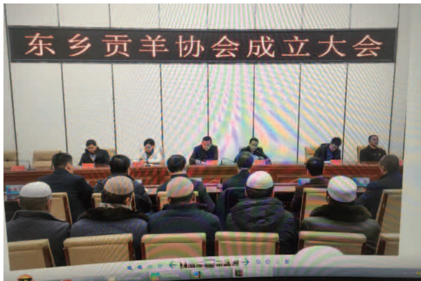
东乡贡羊协会成立大会

【机构】 东乡县特色产业发展服务中心成立于2019年9月，是正科级事业单位，隶属县政府管理，核定事业编制11人，核定科级领导职数3名。按照县委县政府的总体安排部署及相关分解工作任务，主要职责是充分利用地域和自然资源优势，着力打造东乡县域特色产业。