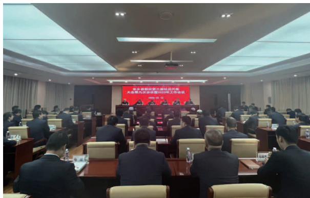
东乡县联社2023年工作会议

【党的建设】 聚焦“学思想、强党性、重实践、建新功”，组织党委理论中心组专题学习17次，党委书记带头讲党课3次，党委班子成员讲党课5次。开展“党建+金融”“党员责任区”“党员先锋队”“党员先锋岗”等主题实践活动，设立7个“党员责任区”，7个“党员先锋队”，14个党员先锋岗；开展联建共建活动4次。组织全体党员干部到临夏市东郊公园胡廷珍烈士纪念馆，接受红色教育；走访慰问退休党员和退休干部；召开“七一”表彰大会；组织召开县联社2023年党建工作会议。与各党支部、各部门、各信用社负责人签订《党风廉政建设目标责任书》。开展案件警示教育和清廉金融文化建设。选派24名干部员