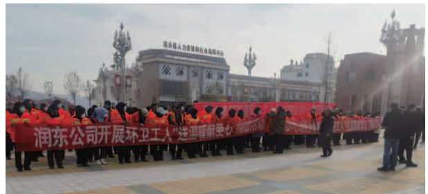
开展环卫工人“送温暖献爱心”捐赠活动

【机构】 东乡族自治县润东水务生态投资有限公司成立于 2019 年 8 月，为东乡县属国有企业，注册资本 500 万元。公司拥有 7 家全资子公司，有职工 107 人。