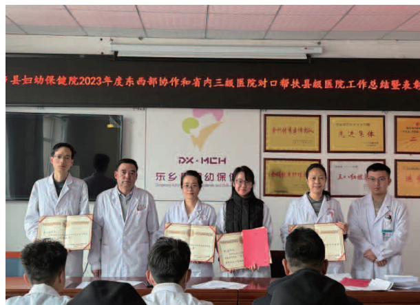
东乡县妇幼保健院 2023 年度东西部协作和省三级医院对口帮扶县级医院工作总结暨表彰会议

【业务工作】 2023 年，门诊接诊 11049 人次，住院 1764 人次，全院总收入 439.97 万元，同比增长 279.71 万元，增长 63.57%；住院人次同比去年同期增长 140.98%，门诊人次同比去年同期增长 36.26%；基本公共卫生服务补助资金农村妇女“两癌”检查项目和政府为民办实事“两癌”检查项目任务数为 4750 人，已完成 4756 人，任务完成率 101%；免费孕前健康检查项目任务总数 761 对，已完成 761 对，任务完成率 100%；新生儿多种遗传代谢病筛查项目任务数 600 例，已完成 635 例，任务完成率 105%；基本公共卫生服务补助资金农村妇女孕前和孕早期增