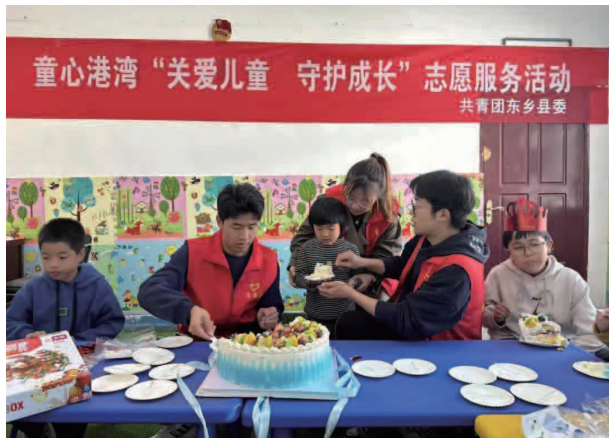
童心港湾“关爱儿童 守护成长”志愿服务活动

所“童心港湾”项目点，立足青少年健康成长，通过整合基层各类阵地、资源，选配“童伴妈妈”、常态化组织开展家访校访、日常陪护、主题活动、志愿服务等关爱留守儿童行动，引导更多社会各界爱心人士积极参与到关爱服务公益活动中来，有效推动留守儿童关爱服务体系建设和，努力让“童心港湾”成为留守儿童的心灵港湾和精神家园。通过积极争取“伙伴计划”项目，在城南社区常态化开展思想引领、发展成长、陪伴教育、艺术特长类等针对青少年及适龄儿童个性发展的志愿服务活动，促进困境青少年成长成才。对接共青团历城区委和团州委争取“希望小屋”项目，先后对符合条件的8名困境儿童改善居住环境，依托原有住房打造独立空间，并配备必要家具和学习生活用品。对接省扶贫基金会，联合东乡县多家部门单位组织实施“情暖困境少年·助力乡村振兴”关爱成长公益项目，为困境少年捐赠关爱成长包1040套，总价值达39.52万元。以新时代文明实践平台为平台，组织全县广大团员青年投身各类志愿服务活动，用实际行动和青春激情让新时代的文明大旗迎风飘扬，2023年以来，积极组织青年志愿者开展学雷锋、护航高考、护航夜经济、普法宣传、自护教育、红色周五、民族团结进步教育、“社区青春行动”、保护母亲河、困境青少年和孤寡老人关爱等各类新时代文明实践志愿服务活动达40余场次，在青