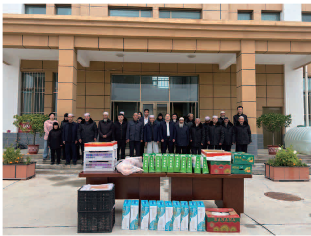
开展“结对关爱”行动，慰问敬老院老人

【机构】 东乡族自治县委巡察办内设综合股、业务股和整改督查股，下设信息中心 1 个股级事业单位，共有工作人员 13 名，其中主任 1 名，副主任 1 名，巡察专员 1 名。