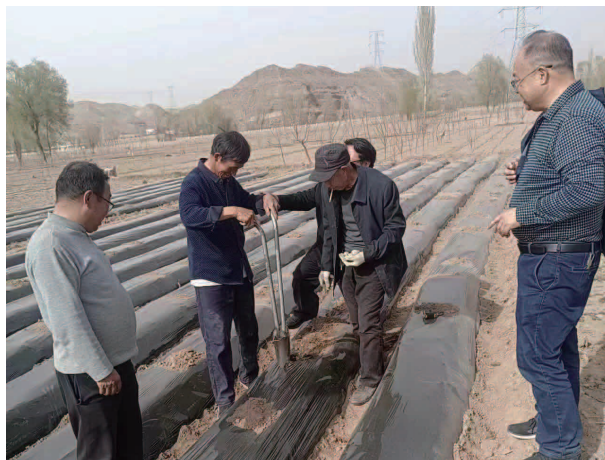
科技特派团田间指导

铝业有限公司高新企业省级补助20万元、州级补助资金10万元；临夏回香斋责任有限公司省创奖补资金5万元，甘肃华广科维新材料科技有限公司省创奖补资金5万元；加强技术市场引导，通过多方联系，对接衔接，共签订技术交易合同金额2880万元。