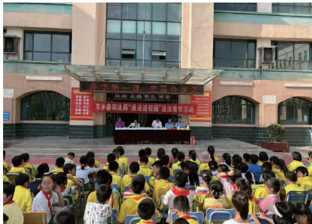
“送法进校园”法治宣传活动

【矛盾纠纷化解】 坚持和发展新时代“枫桥经验”，进一步深化矛盾纠纷分级分类多元调处机制，提升矛盾纠纷多元排查化解能力，调整完善《人民调解个案补贴的经费管理办法》，落实个案补贴 66700 元，人民调解员队伍工作积极性进一步提高。全县 1659 人民调解员活跃在 237 个人民调解组织一线，今年以来调处各类矛盾纠纷 1590 件，调处成功 1585 件，调解成功率 99.6%，有效