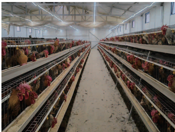
大岭村石拉录池社养鸡场

草作物的种植面积，试种藏红花等经济作物。在拱北湾村和周杨村易地搬迁点流转土地 80 亩，改造建设温室大棚 60 座，打造现代寒旱特色农业蔬菜基地，主要种植西红柿、黄瓜、番茄等蔬菜，平均年产值达 110 万元左右，销售方面主要通过订单销售、观光采摘、礼盒直销、电商带货等方式出售，可长期提供稳定就业岗位 20 人左右，临时用工 600 人次，为村集体经济分红 10 万元左右。种植脱毒马铃薯 3.2 万亩，玉米 6400 多亩，藜麦 2200 亩，紫花苜蓿 8000 亩；发放脱毒马铃薯种薯 106.275 吨，发放藜麦种子 2000 亩，结合撂荒地整治共计流转土地 6300 余亩，提质增效土地