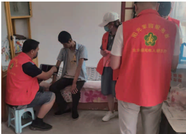
居家阳光托养服务

【结对关爱】 开展困难重度残疾人结对关爱工作，关注残疾人生产生活。全县共有困难重度残疾人结对关爱对象 2420 户 3101 人，其中省上结对 95 户 106 人，州上结对 459 户 488 人，县上结对 1866 户 2507 人。各级结对干部共联系交流 12765 次，走访探视 8028 次，落实各类政策 8549