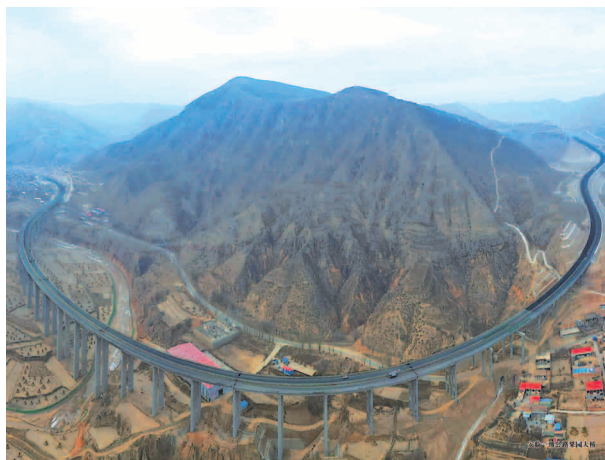
安临一级公路果园大桥

【项目建设】重点实施S230线何家湾大桥至达板公路、达板镇易地扶贫搬迁后续产业园道路及配套设施建设、农村公路提质改造、东乡县唐汪镇旅游产业道路（一期）工程等重点建设交通项目11项，总投资7.41亿元。