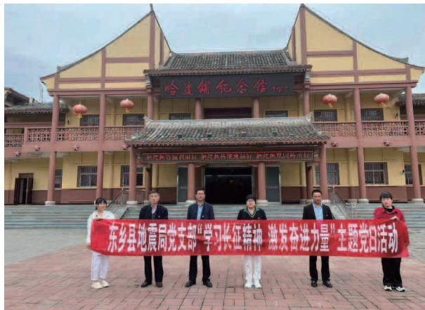
“学习长征精神 激发奋进力量”主题党日活动

【突出重点，提升防范能力】 积极配合省地震局完成了第一次全国自然灾害风险普查工作任务，编制完成了东乡县区域地震构造图和东乡县区域地震概况资料，为全县下一步进行重大项目建设提供了基础和保障；严格执行了地震监测设施环境的保护，审查核实了永靖—井坪高速公路设计及施工对达板镇黑石山村地震监测站台的影响；认真开展建设工程地震安全监管工作，进一步加