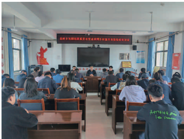
北岭乡重点工作安排会

【社会事业】有义务教育阶段适龄生1678人，县内就读1081人、县外就读596人，其中送教上门2人，无接受教育能力1人。2023年全乡医疗保险个人参保5263人，参保率95%；2024年基本医疗保险个人参保5591人，参保率95.47%。实施抗震房改造11户，年中开展自建房排查整治“回头看”2435座，每月开展住房安全动态监测巡查，确保群众住房安全。5个村全部配备水管员正常开展工作，确保全乡居民饮水安全。