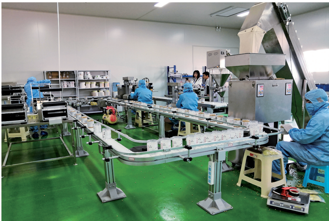
环县特色小杂粮依靠电商平台热销国内外