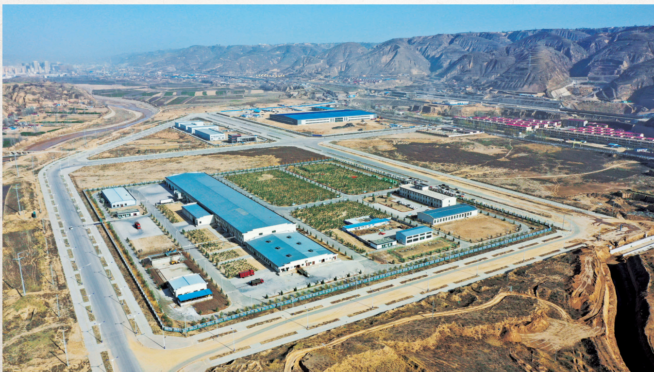
多家产业化龙头企业入驻县城工业园区