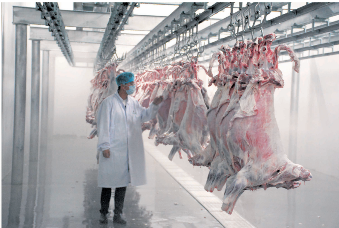
中盛公司羊肉加工生产线