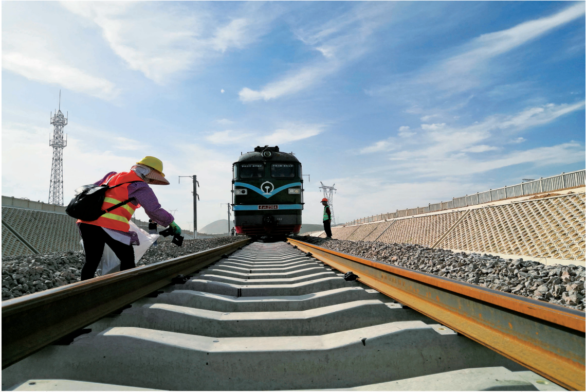
银西高铁环县段完成铺轨