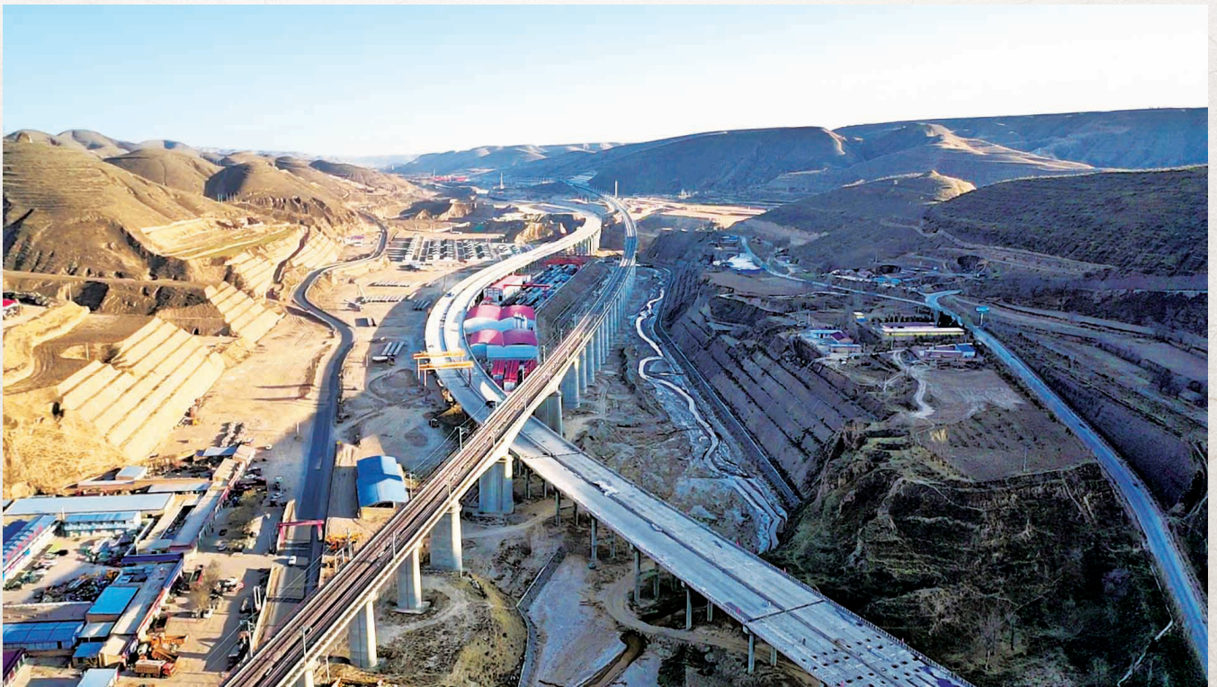
银西高铁、甜永高速建设加快实施