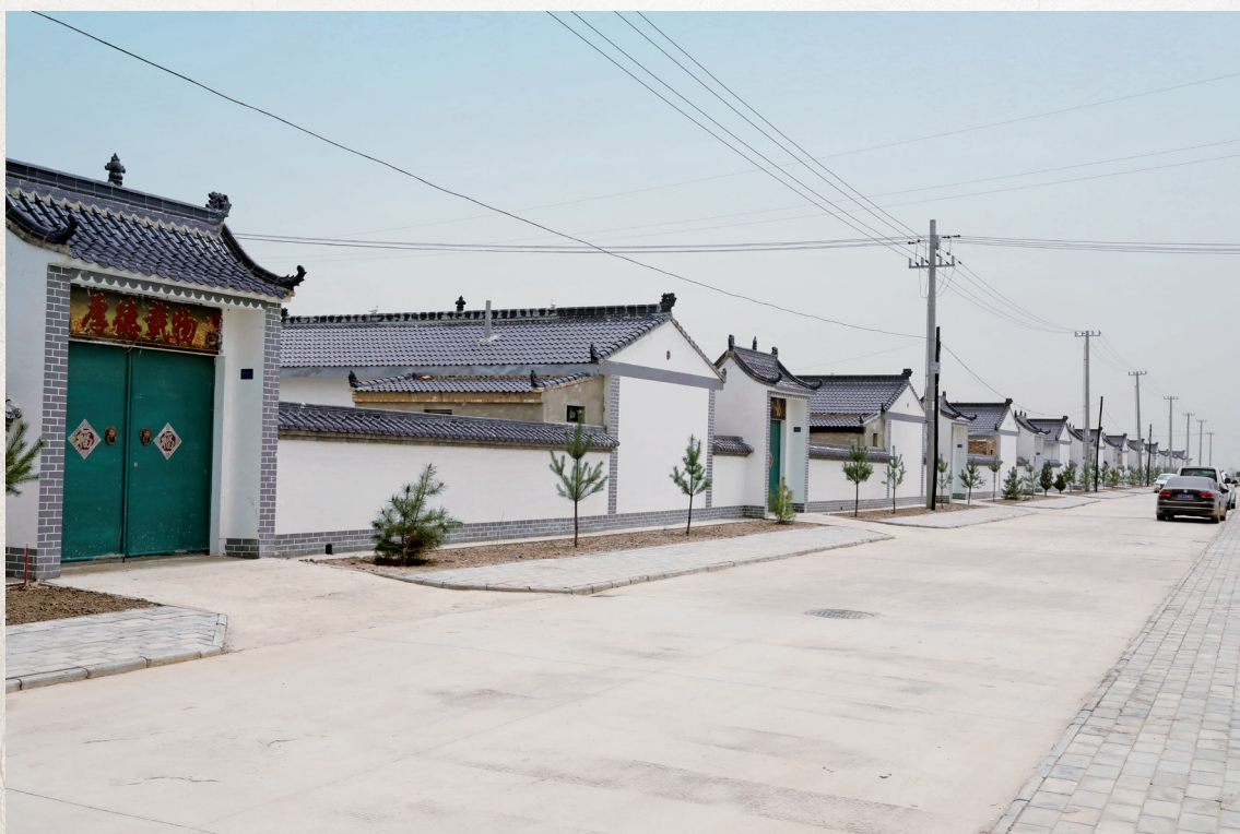
2019年，环县加快实施易地扶贫搬迁项目。图为虎洞镇砂井子村张塬村民小组易地扶贫搬迁点