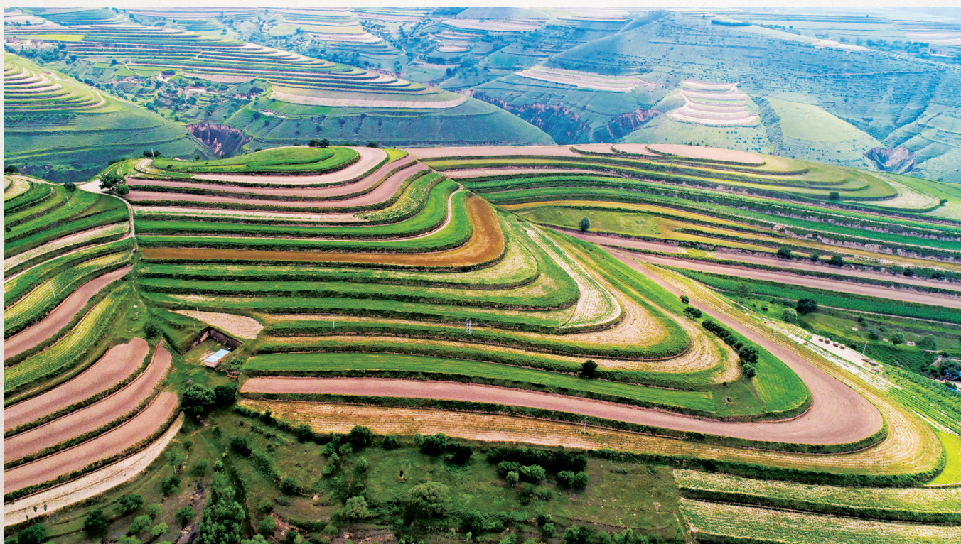
环县加快梯田建设，实施粮改饲项目