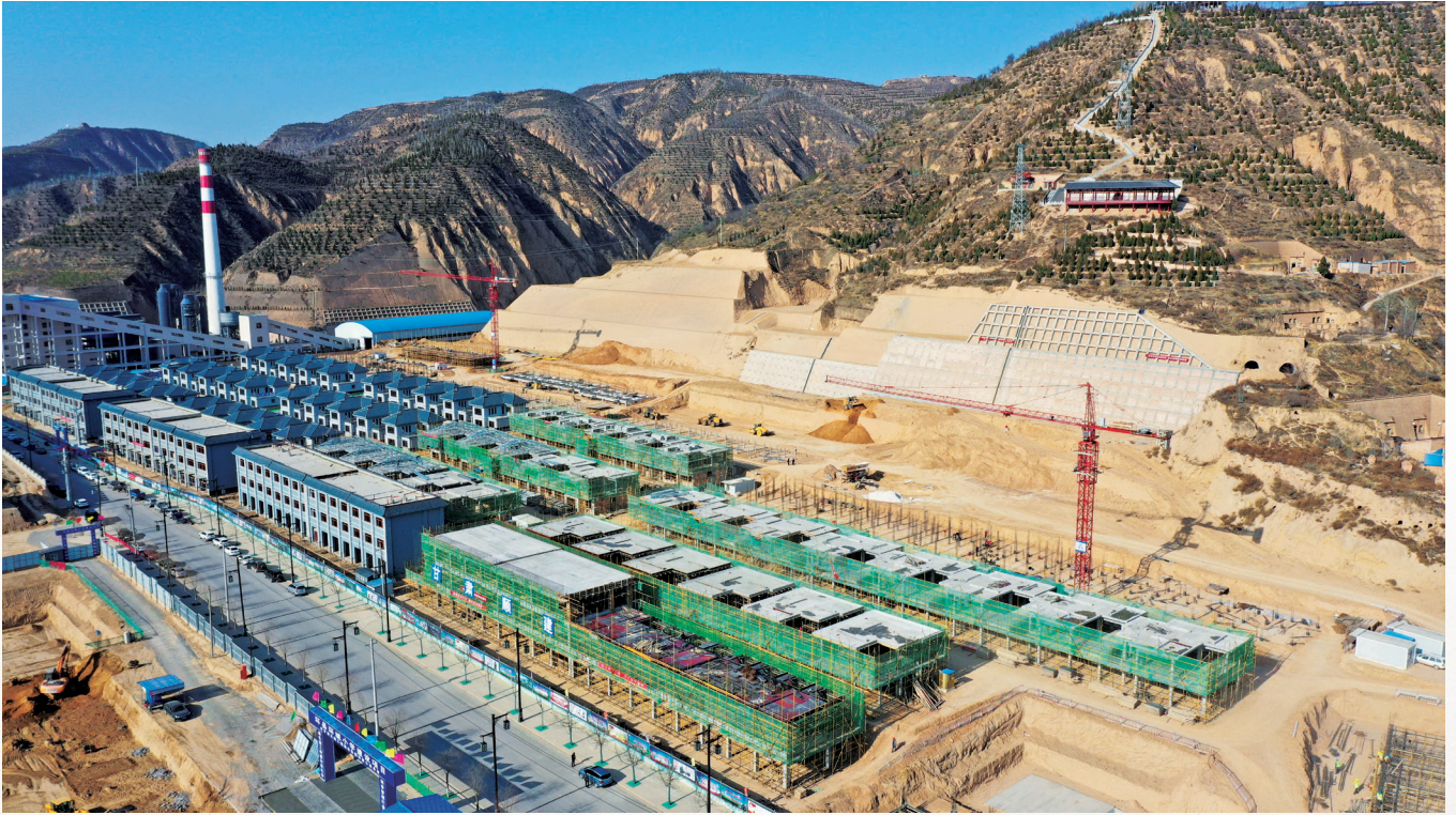
县城棚户区改造加快实施