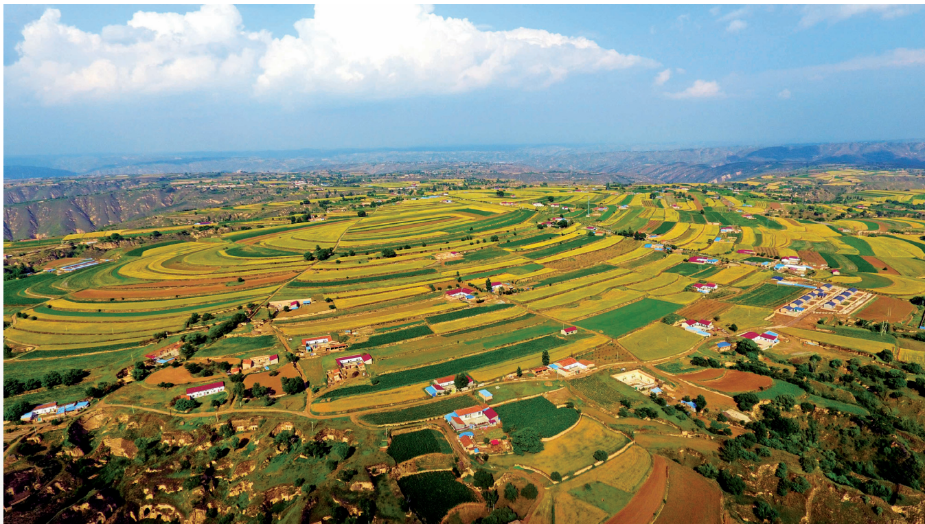
环县加强农业产业培育，全县粮食产量超40万吨