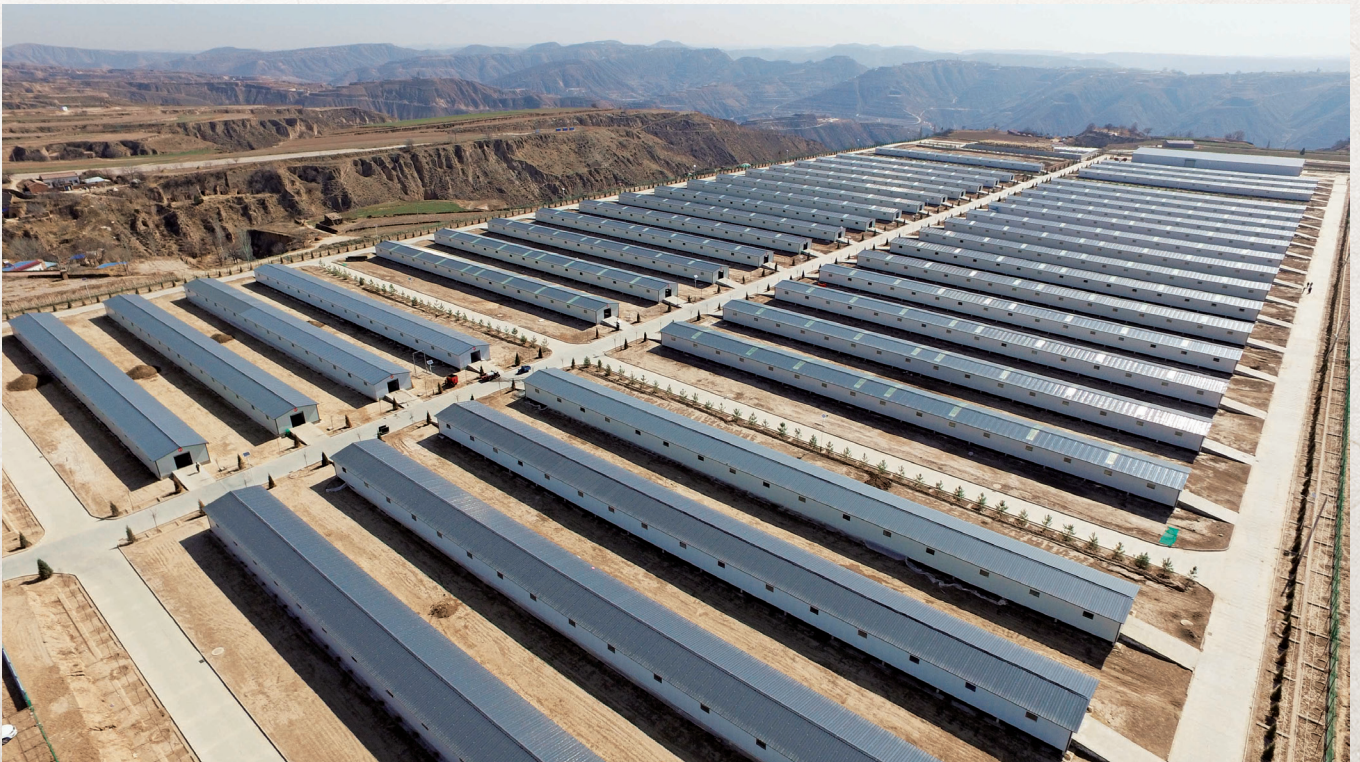
中盛公司规模化肉羊养殖场